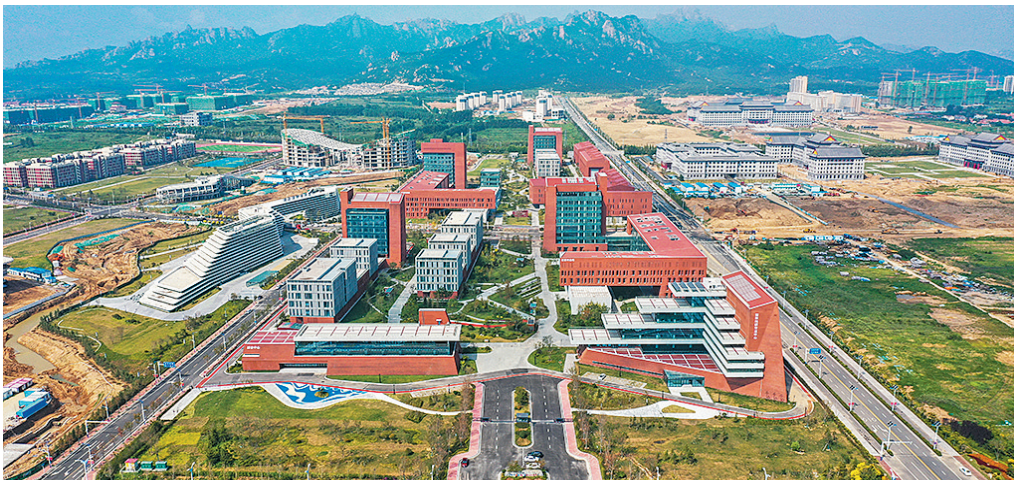
位于青岛西海岸新区的中科院海洋大科学研究中心。

从世界发展历程来看,现代化的概念发轫于工业革命,现代化过程就是科技发展并扩散、应用到经济社会各个领域的过程。