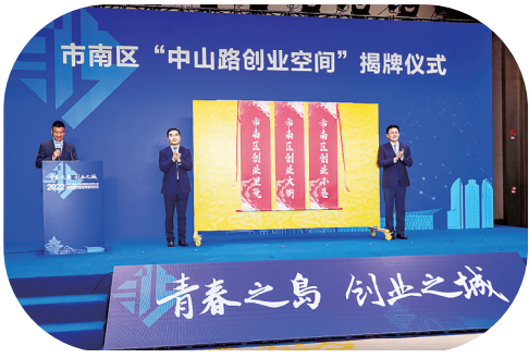
■“中山路创业空间”揭牌仪式。