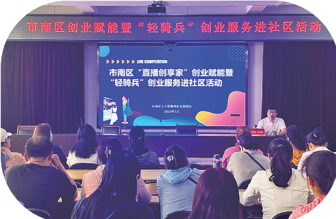
■“轻骑兵”把创业服务送进社区。