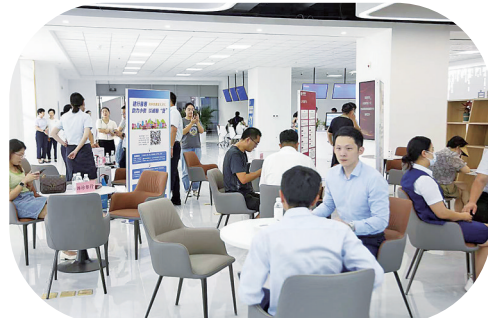
■市南区组织银企对接会。