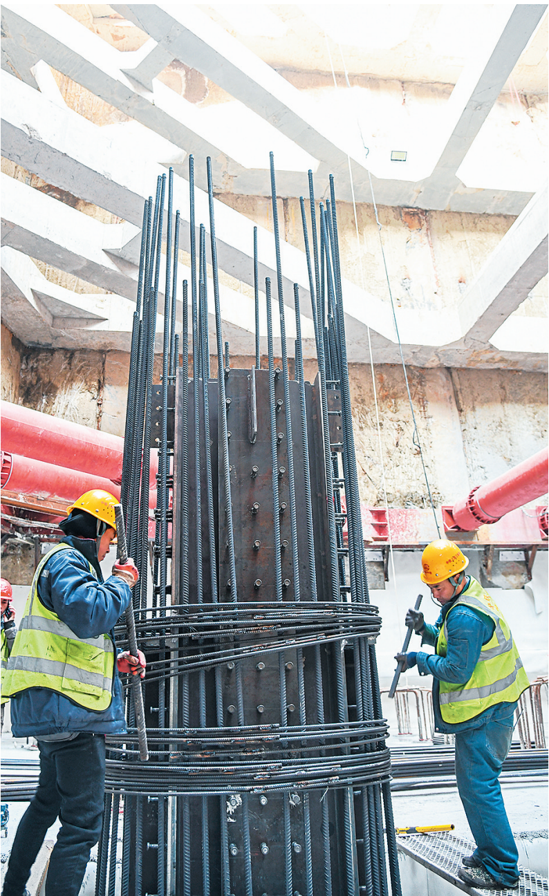
■在地铁5号线云岭路站地下近30米处,施工人员正紧张作业。