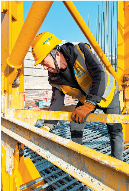
■在中铁建工青岛污水处理厂地下箱体项目现场,施工人员正在加固塔吊基础。