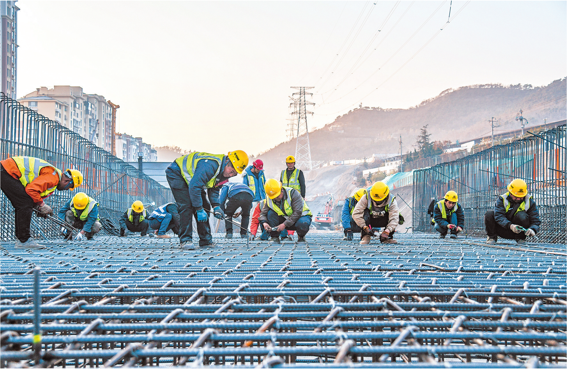
■工人们在唐山路打通工程现场绑扎钢筋。