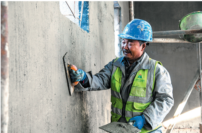
■在历史城区施工现场,墙体立面施工正在推进。