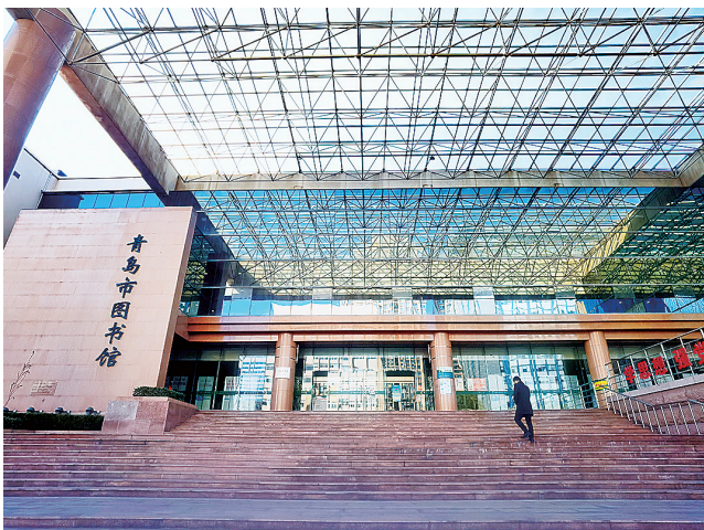
■青岛市图书馆的正门入口。