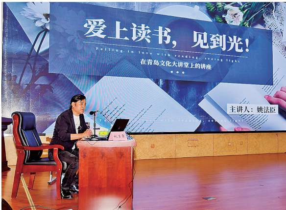
■市图书馆的“文化大讲堂”品牌活动已深入人心。