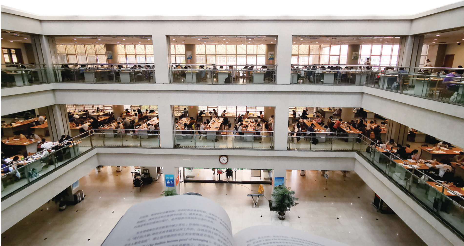
■市图书馆 永远一座难求。

到图书馆只是为了借书或者看书吗？当然不是。时下，这个曾在当年深得文艺青年钟爱的文化公共空间，正在全方位构建一种人与书的新型相处方式，以丰饶的“大文化”方式激活城市文艺想象力，承载起时代的文化理想和生活情怀，氤氲为城市的新意象和新形神，从城市的精神港湾变身有品位、有温度的城市会客厅。