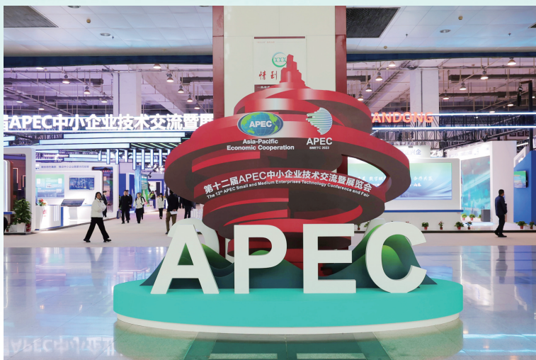
■第十二届APEC中小企业技术交流暨展览会现场。

第十二届APEC中小企业技术交流暨展览会由工业和信息化部与山东省人民政府共同主办,已于11月9日在青岛国际会展中心胜利开幕。工商银行作为“首席战略合作伙伴”参与本届技展会,心系民生福祉,全方位展示服务实体经济、赋能中小企业高质量发展的各类创新举措。