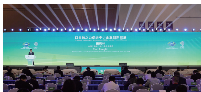
■《以金融之力促进中小企业创新发展》主旨演讲。

工商银行将深入学习贯彻中央金融工作会议精神,以本届APEC技展会作为展示金融服务中小企业的重要窗口,始终胸怀“国之大者”,坚决履行好服务实体经济主力军职责,继续全力支持APEC框架下的各项活动,让合作的力量发挥更大价值,为APEC成员经济体和“一带一路”沿线国家和地区高质量发展注入更多稳定性、确定性和正能量,为全面建设社会主义现代化强国贡献金融力量,为金融服务中国式现代化贡献工行力量,为建设金融强国贡献青岛力量。