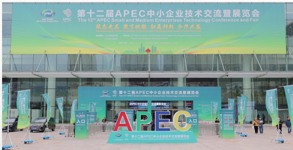
■第十二届APEC中小企业技术交流暨展览会入口。