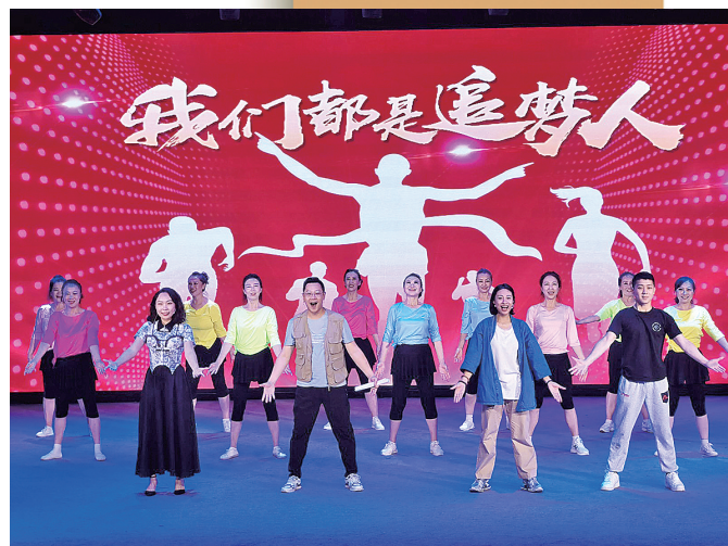
■市北区首届戏剧节等群众文艺活动百花齐放。