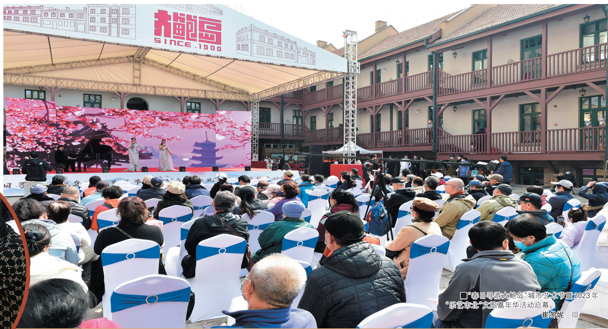
□“春日寻游大鲍岛”城市艺术节暨2023年“乐艺市北”文旅嘉年华活动启幕。