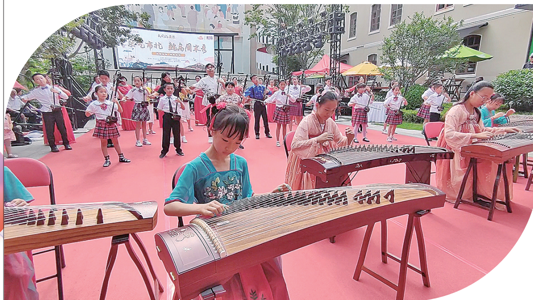
■“乐艺市北·鲍岛周末秀”公益演出。