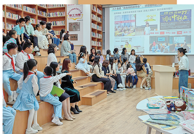
■市北区第二届读书节推出“北北妈妈故事会”活动。