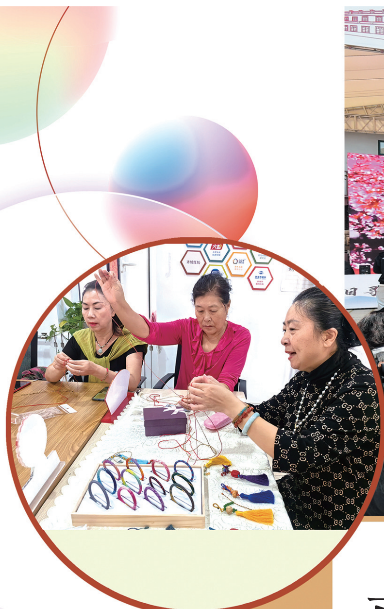
■“午间六十分 文化初体验”手工编织走进社区。