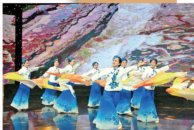
■市北区居民在群众文化艺术节上展示自编的舞蹈。

为盘活现有的文化资源，整合市场精品文化力量，促进传统与时代碰撞，市北区不断探索新路径。新打造里院美术馆、里院生活记忆馆、三兴里艺文空间等精品文化空间5000余平方米；推动音乐livehouse、沉浸式剧游、即兴互动剧等先锋文化演出形式在城区落地开花，吸引Downtown Live、上客喜剧小剧场、Galli剧团等落户，提升城区艺术品质，构建时尚化、科技化、数字化、智能化的公共文化空间。