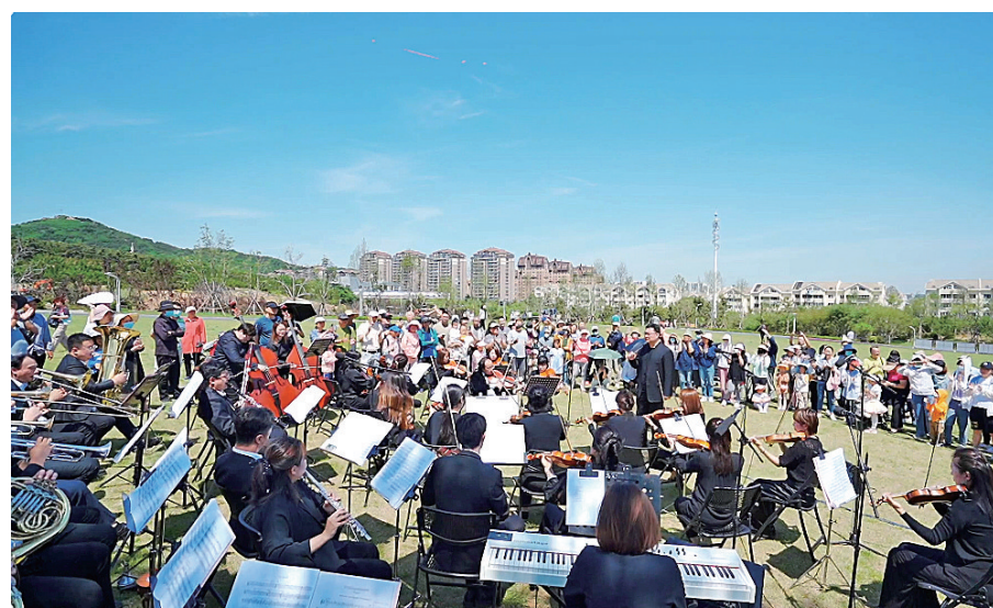
■“音你而行”浮山森林音乐节等活动，线上线下参与近10万人次，提升了城区文化氛围。