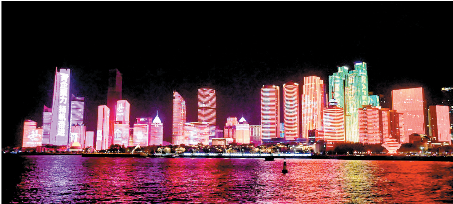
■11月7日晚，一场以“青岛企业家日”为主题的光彩秀在浮山湾上演。

从近200位参加活动的企业家身上，能充分感受到企业家群体天生的那份乐观主义和进取精神。对一座城市来说，身处百年未有之大变局中，企业家和企业家精神比过去任何时候都重要。相信这群对青岛、对未来信心满满的的企业家，将推动青岛经济社会发展不断突破天花板，实现城市能级的再跃升。