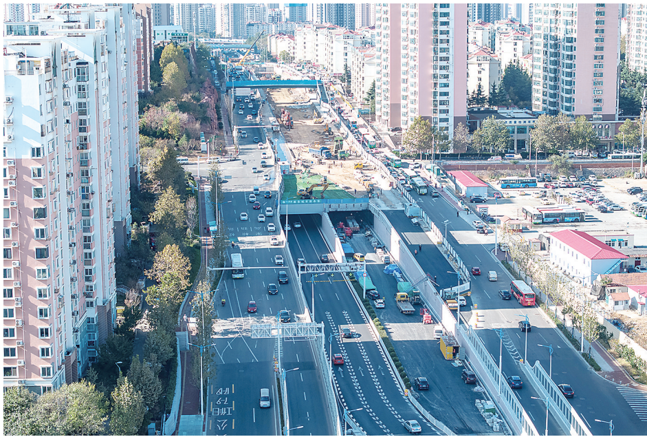
■11月7日，辽阳路快速路工程北半幅地道主体结构实现封顶。

项目全长4.7千米，其中地道全长约1215米(闭口段785米+敞口段430米)。项目建设