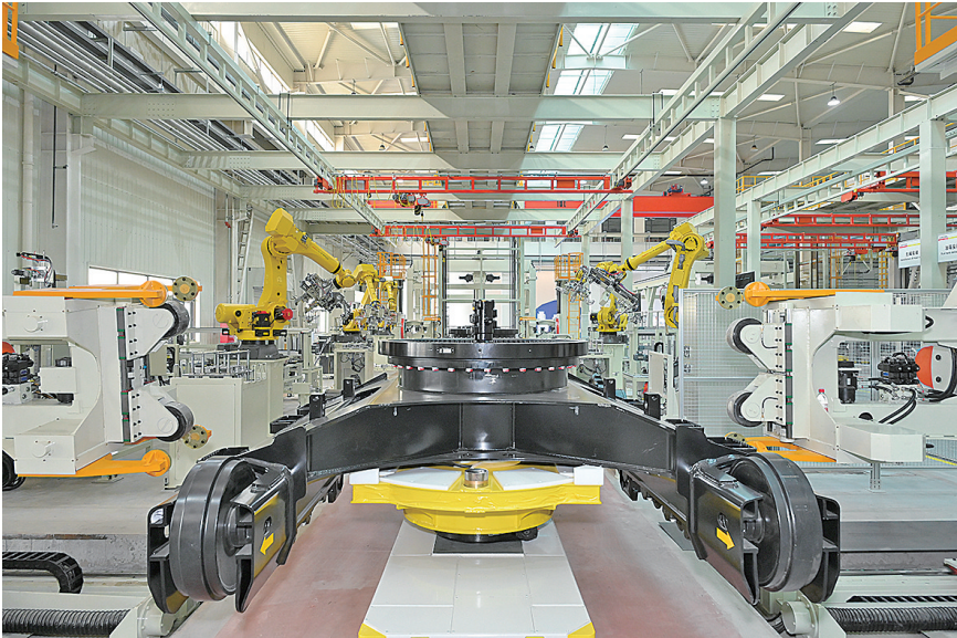
■潍柴(青岛)智慧重工智造中心项目智慧装备生产线。

一年时间实现建成投产。这个速度的达成,得益于青岛全过程、全要素的服务保障。建设过程中,青岛开发区统筹建立由功能区、属地街道、国有企业、职能部门组成的“四位一体”保障机制,保障项目快速推进,先后创造了19天完成装配车间首根钢结构吊装、57天实现办公楼主体封顶、40天实现餐厅主体封顶等项目建设新速度。