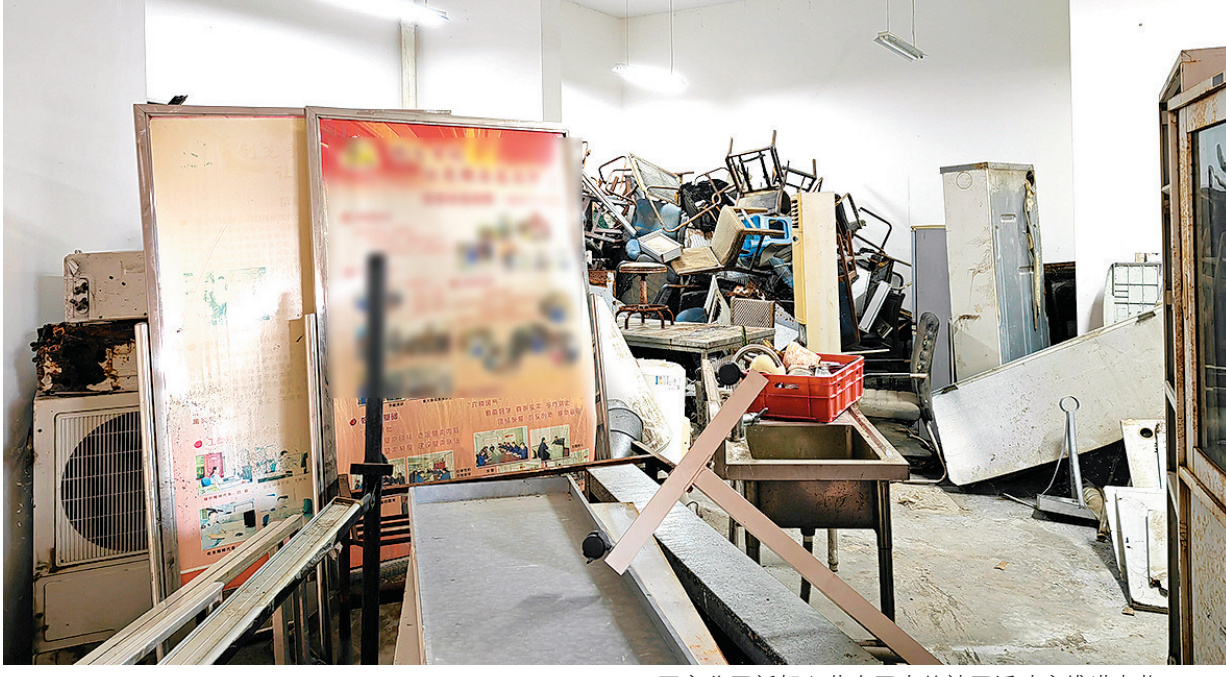
■市北区新都心苑小区内的社区活动室堆满杂物。

部分市民反映，一些已落成的社区活动室不能使用，他们无法“近”享家门口的福利和便利。记者梳理了市12345政务服务便民热线、党报热线82863300、观海新闻客户端“直通12345”平台近3个月受理的信息，发现有关社区活动室不开放的投诉约120条，涉及七区三市的51个社区活动室。