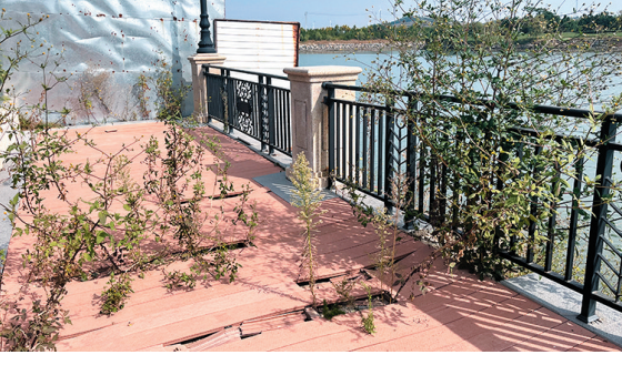
▲野草从栈道破损处长出。