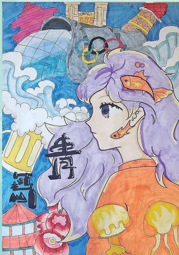
王贝语格 青岛宜阳路小学