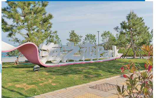
■新建成的海之恋公园。