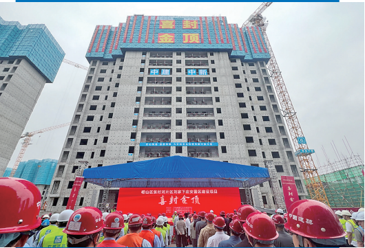
■张村河片区首批社区安置区项目封顶。