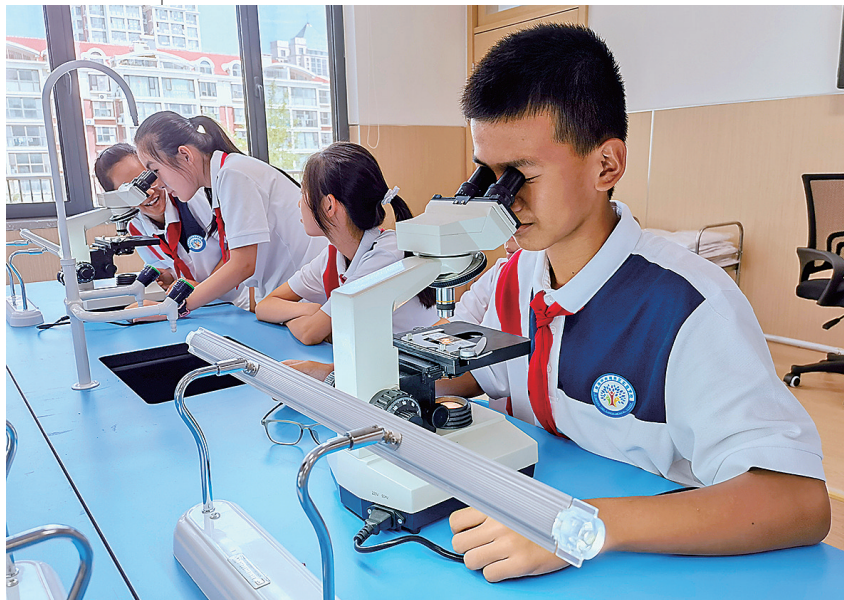
■青岛中央商务区实验学校的学生在实验室上课。