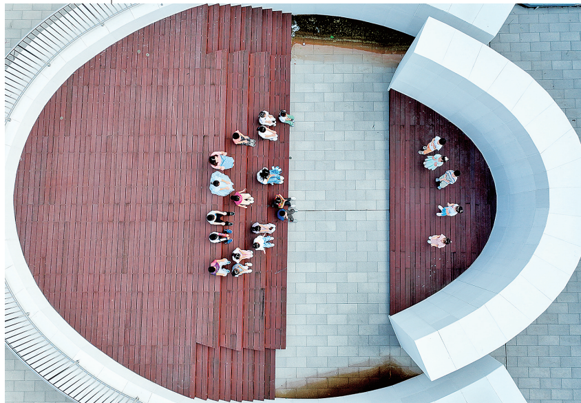
■青岛育新小学的孩子们在校园空中剧场表演节目。