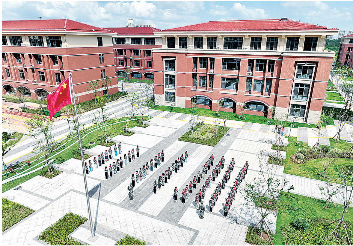
■胶州市振华实验学校的学生在校园里军训。