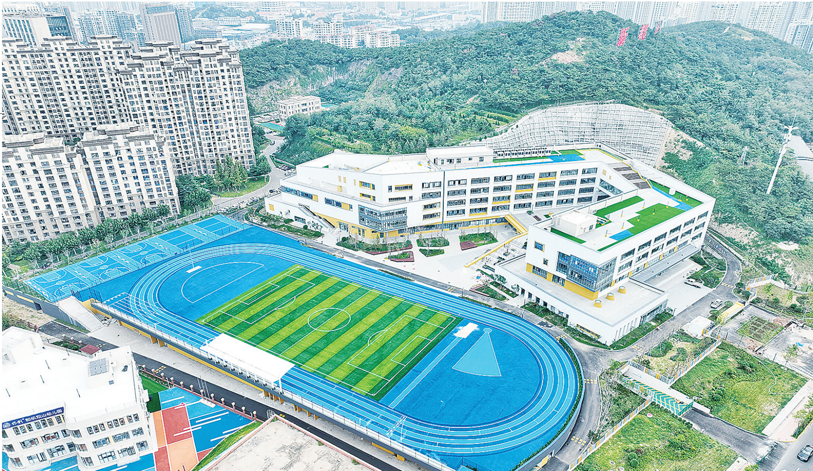
■青山环抱中的青岛育新小学。