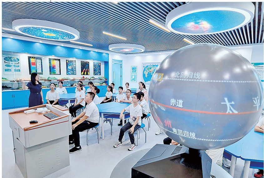
■中国海洋大学附属实验学校学生在上地理课。