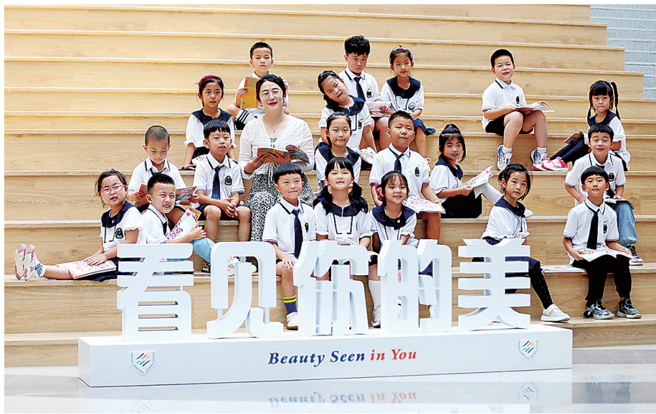
■城阳区景明学校新生和老师们在宽敞的阅读角里读书。