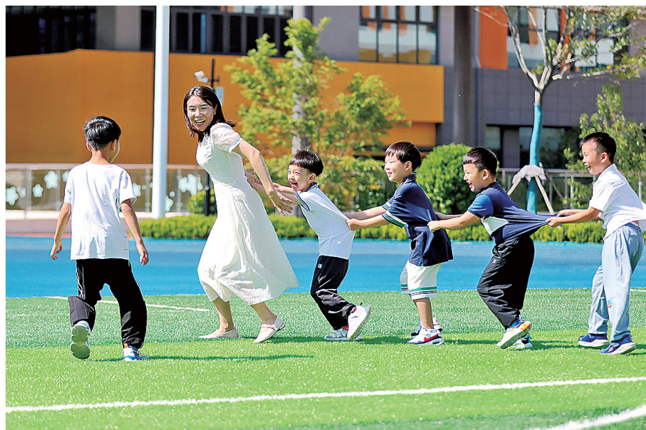
■青岛市第二实验小学北校的师生在操场上游戏。