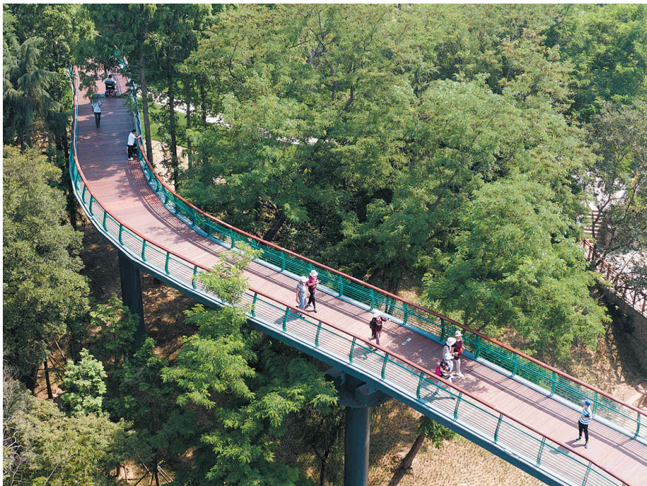
▲太平山中央公园延安一路景观桥。

在推动城市交通更加顺畅方面,开展城市交通拥堵治理攻坚行动,清单化推进238处堵点治理,把堵点治理纳入城市更新和城市建设统筹推进,从路网建设、交通设施、智慧调控、停车泊位等方面综合施策,为道路交通拥堵治理提供基础保障,持续优化道路交通秩序;开展停车场管理整治攻坚行动,打造“全市一个停车场”,停车泊位数据联网接入并稳定运行的不少于70万个,同时丰富