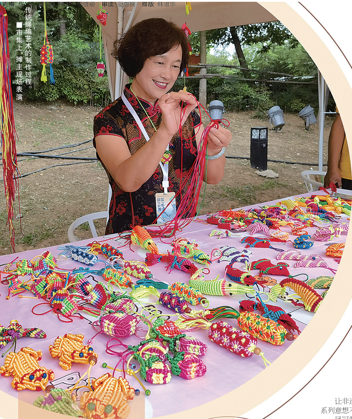
传统绳编艺术的制作过程。 ■市集上，摊主现场表演

长河潮起浪有声。盛夏的白沙河畔，人们的目光总是情不自禁追逐着翩跹的白鹭。它掠过岸堤林木的苍翠、微风中重叠的波影，在细雨微蒙中，尽情舒展着优雅身姿。大暑时节，人与自然和谐共生的生态画卷，带来宁静与沉醉。