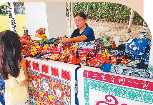
■非遗文化节上的一些手工小制品吸引了孩子的目光。