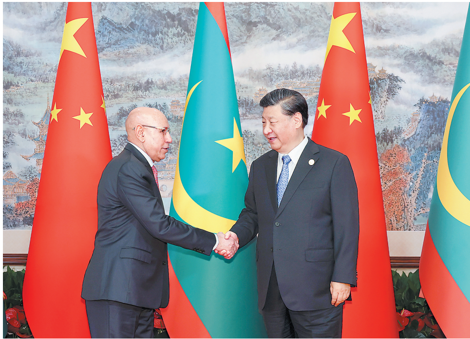
7月28日下午，国家主席习近平在成都会见来华出席第31届世界大学生夏季运动会开幕式并访华的毛里塔尼亚总统加兹瓦尼。

新华社成都7月28日电(记者温馨 袁秋岳)7月28日下午，国家主席习近平在成都会见来华出席第31届世界大学生夏季运动会开幕式并访华的毛里塔尼亚总统加兹瓦尼。 习近平指出，中毛建交58年来，双方始终真诚相待、相互支持，结下了深厚友谊。面对世界百年变局，中毛两国要继续做相互支持的好朋友、共谋发展的合作伙伴，携手维护两国共同利益和国际公平正义。去年底我们在沙特利雅得共同出席首届中国—阿拉伯国家峰会并举行会晤，达成许多重要共识，相信你这次访华将为两国关系未来擘画新蓝图。 习近平强调，中方感谢毛方在涉及中国核心利益问题上始终同中方坚定站在一起，将一如既往支持毛方走符合自身国情的发展道路，反对外部势力干涉毛里塔尼亚内政。中方愿同毛方加强治国理政经验交流，继续向毛方提供力所能及的帮助，充分发挥援毛农业、畜牧业两个技术示范中心作用，加强菌草种植技术合作，深化渔业、农业、畜牧业等领域合作。相信中毛签署共建“一带一路”合作规划，将深化和拓展两国各领域交流合作。