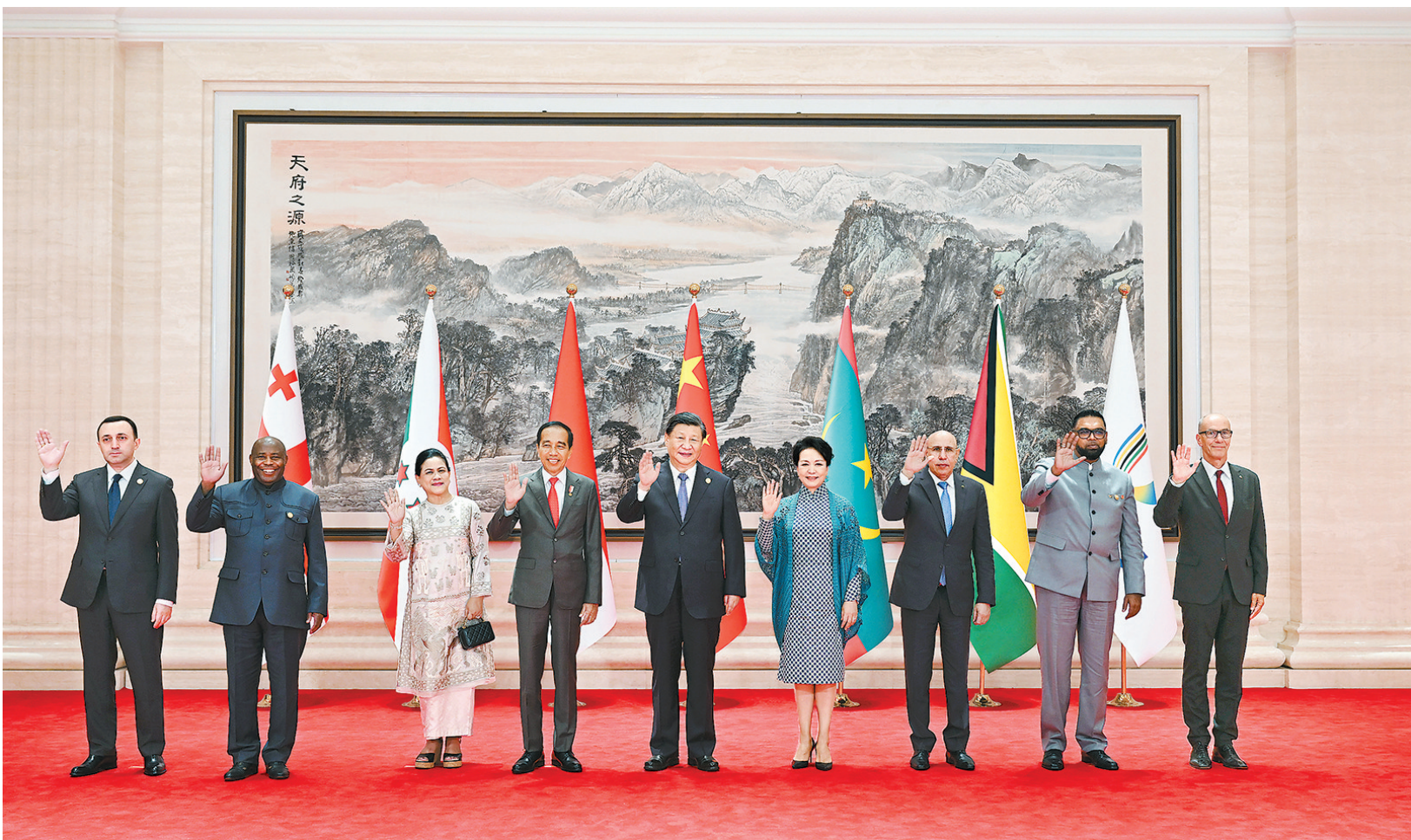
7月28日中午，国家主席习近平和夫人彭丽媛在四川省成都市金牛宾馆举行宴会，欢迎出席成都第31届世界大学生夏季运动会开幕式的国际贵宾。这是习近平和彭丽媛同贵宾们合影留念。新华社照片

要深化交流互鉴，以包容的胸怀构建和而不同的精神家园，用欣赏、互学、互鉴的态度对待多种文化，弘扬全人类共同价值，谱写推动构建人类命运共同体新篇章。 习近平指出，成都是历史文化名城，也是中国最具活力和幸福感的城市之一。欢迎大家到成都街头走走看看，体验并分享中国式现代化的万千气象。(致辞全文另发) 蔡奇、丁薛祥、王毅、李干杰、王小洪、谌贻琴等出席活动。 欢迎宴会开始前，贵宾们欣赏了四川非物质文化遗产展示。