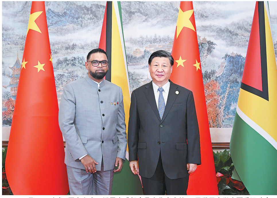
7月28日上午，国家主席习近平在成都会见来华出席第31届世界大学生夏季运动会开幕式并访华的圭亚那总统阿里。

新华社成都7月28日电(记者袁帅 周相吉)7月28日上午，国家主席习近平在成都会见来华出席第31届世界大学生夏季运动会开幕式并访华的圭亚那总统阿里。 习近平指出，中国和圭亚那虽然相距遥远，但友谊源远流长。圭亚那是加勒比地区最早承认一个中国原则并同新中国建交的国家。去年，中圭隆重庆祝了建交50周年。近年来，圭亚那经济快速发展，国家建设日新月异，中国正在以高质量发展全面推进中国式现代化。中圭两国要做彼此信赖、相互倚重的老朋友，共享机遇、共迎挑战、共谋合作、共促发展，推动构建更加紧密的中圭命运共同体。 习近平强调，中国和圭亚那同为发展中国家，应该从两国人民根本利益和长远利益出发，加强沟通合作，坚定相互支持，推动中圭关系行稳致远。中方愿推动共建“一带一路”倡议同圭亚那“低碳发展战略2030”深度对接，提升两国高质量共建“一带一路”合作水平。欢迎圭方参加中国国际进口博览会，推动更多圭亚那特色优质产品进入中国市场。中方鼓励中国企业赴圭亚那