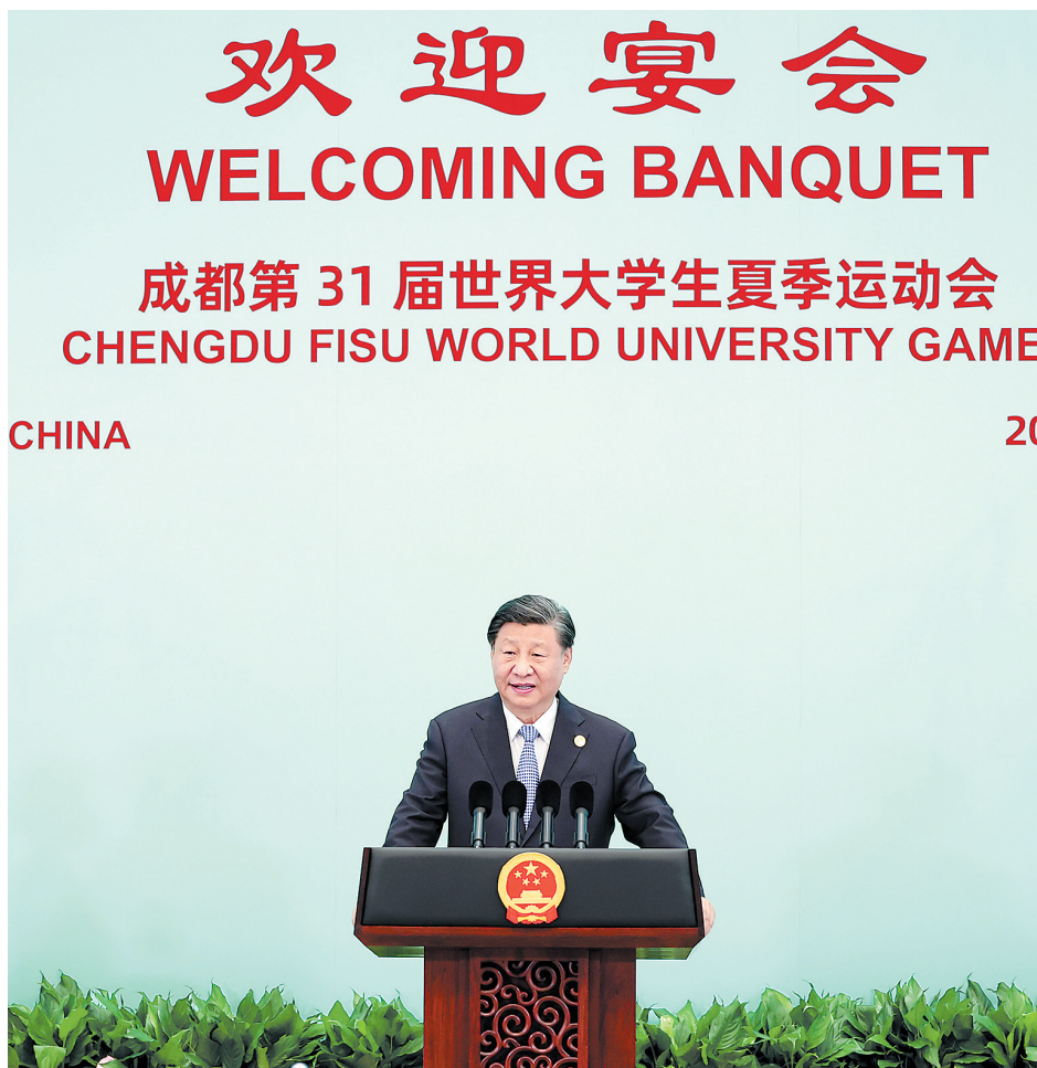
7月28日中午，国家主席习近平和夫人彭丽媛在四川省成都市金牛宾馆举行宴会，欢迎出席成都第31届世界大学生夏季运动会开幕式的国际贵宾。这是习近平发表致辞。

新华社成都7月28日电(记者刘华 叶含勇)7月28日中午，国家主席习近平和夫人彭丽媛在四川省成都市金牛宾馆举行宴会，欢迎出席成都第31届世界大学生夏季运动会开幕式的国际贵宾。 他们是：印度尼西亚总统佐科和夫人伊莉亚娜、毛里塔尼亚总统加兹瓦尼、布隆迪总统恩达伊施米耶、圭亚那总统阿里、格鲁吉亚总理加里巴什维利以及国际大体联代理主席艾德。 习近平和彭丽媛同贵宾们一一亲切握手，互致问候并合影留念。