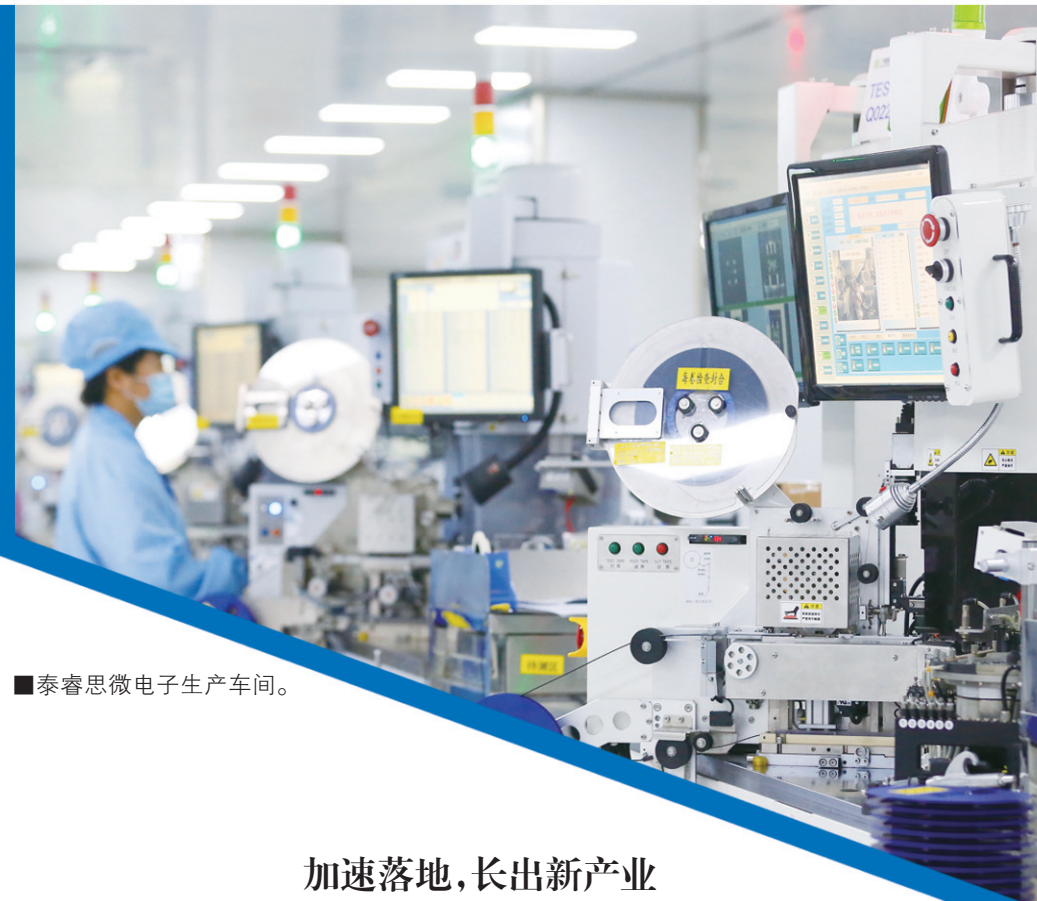
■泰睿思微电子生产车间。