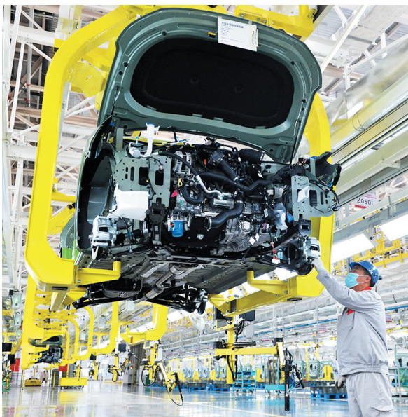
■奇瑞青岛超级工厂总装车间。

“大抓项目、抓大项目”的理念已经深入这座城市的发​​展轨迹，正刷新着这座城市的产业格局，为实体经济发展注入强劲动力。