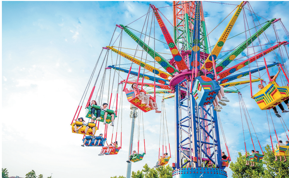
■市民游客在金沙滩啤酒城体验游乐设施。

工作人员介绍,市民游客购买畅饮门票即可当天无限畅饮所有酒品。“超级 PENG”酒桶单日畅饮票为 258 元/位,可通过小程序下单购买,现场验码后凭发放的手环参加畅饮,饮用时间段为当日 11:00—23:00。此外,“超级 PENG”酒桶还单杯买断,全部种类的精酿啤酒售价 30 元/杯(330ml),优惠小套