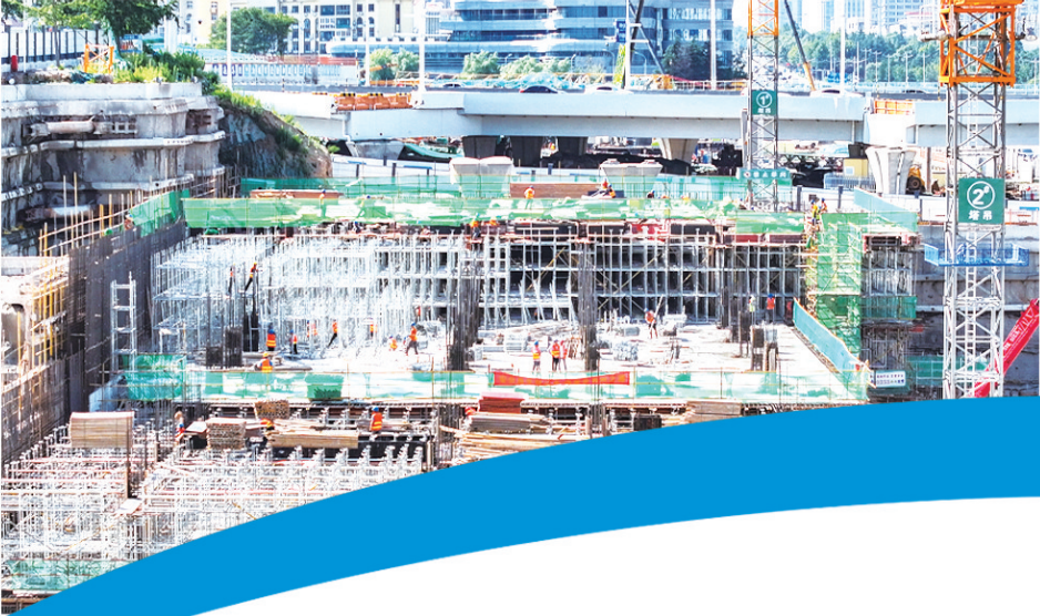
■海尔路—银川路立交工程建设正酣。