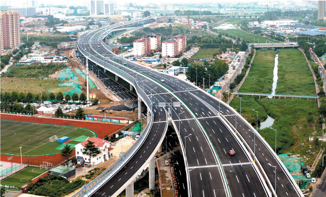
■跨海大桥高架路二期。

旧城旧村改造是城市更新建设中的“硬骨头”，同时也是城市高质量发展的关键。城中村改造，不是简单的拆和建，而是与重大基础设施建设、产业布局调整有机结合起