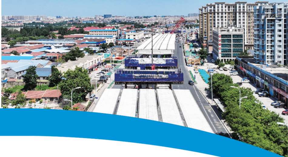
■建设中的重庆路快速路。