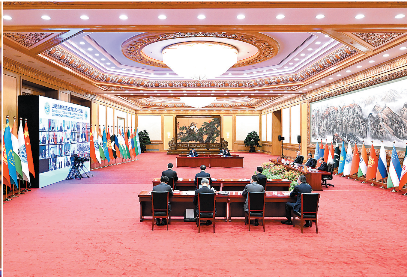
7月4日下午,国家主席习近平在北京以视频方式出席上海合作组织成员国元首理事会第二十三次会议并发表题为《牢记初心使命 坚持团结协作 实现更大发展》的重要讲话。