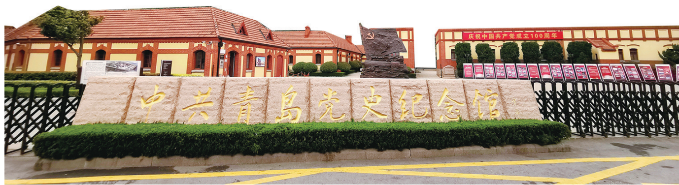
■海岸路18号