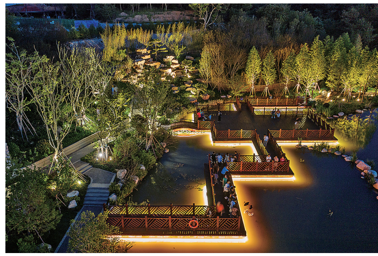
■华灯初上，浮山北麓流光溢彩。