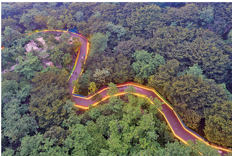
■夜幕降临，太平山休闲步道如“彩带”蜿蜒于密林中。