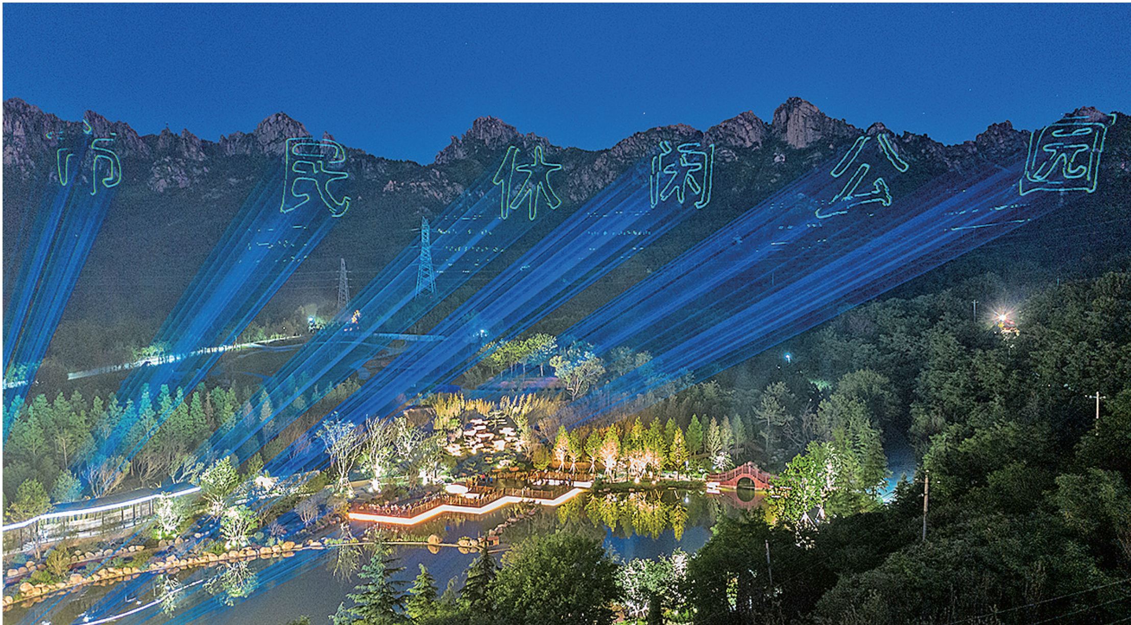
■“生态绿色长廊”“市民休闲公园”等字样通过激光投射在浮山山体上。