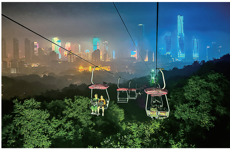
■乘坐太平山索道空中“漫步”，一览岛城瑰丽夜色。