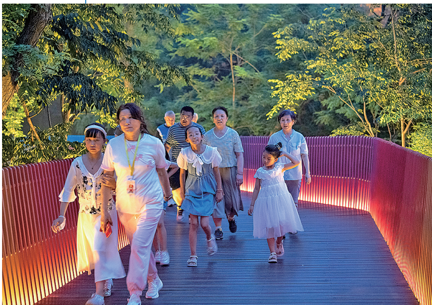
■市民游客漫步于太平山彩虹桥。