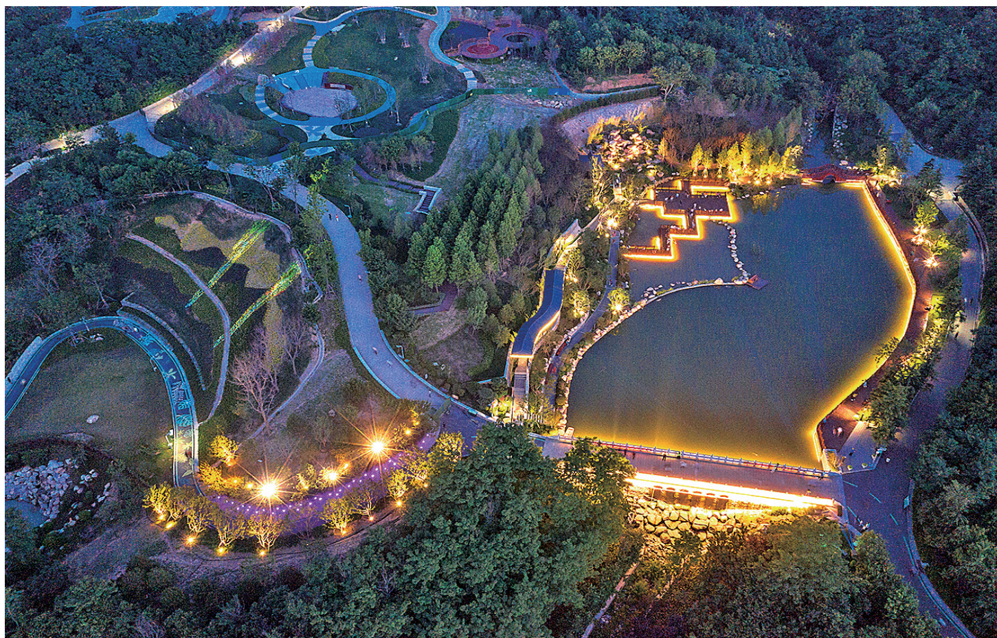
■夜色中的浮山美轮美奂。