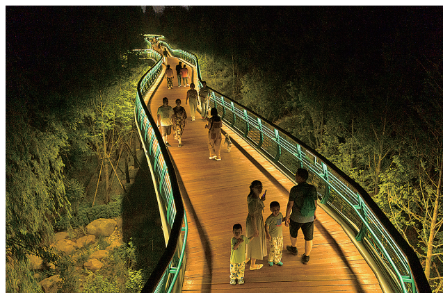
■夜晚的太平山延安一路景观桥别有一番景致。