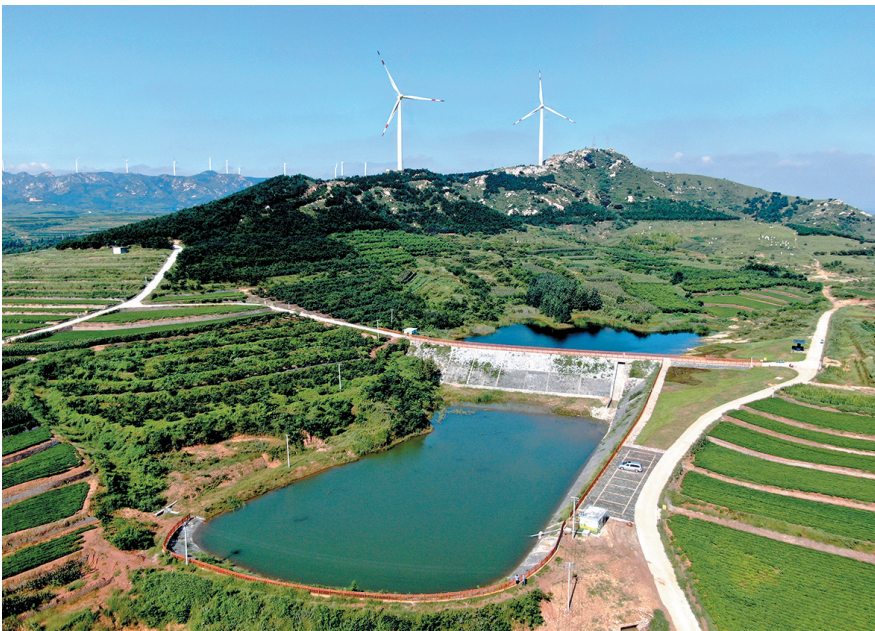
■小吴家村土地整治成果。

市委、市政府出台《关于落实最严格耕地保护制度的意见》，强化耕地保护顶层设计。从压实耕地保护责任、严控建设占用耕地、强化耕地用途管制、严格补充耕地监管、加强耕地执法监督、完善保护激励约束六方面，制定了18条具体意见。同时，青岛市出台了《青岛市耕地保护激励办法》，每年评选耕地保护工作成效突出的区（市）、镇（街道），分别给予新增建设用地指标和