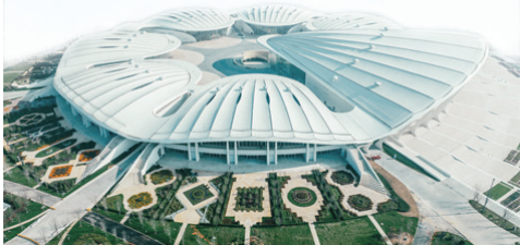
■6月15日至18日，上海合作组织国际投资贸易博览会将在青岛·上合之珠国际博览中心举办。

扩规模，抢订单。 今年以来，青岛先后策划举办了3个大型行业会议，邀请400余家国内外知名上游组展企业，与青岛的展馆企业、展装企业等交流洽谈，达成战略合作33个，促成17个大型展会延续合作或前来举办，为本地企业争取更多会展“订单”，实现了精准补链强链。