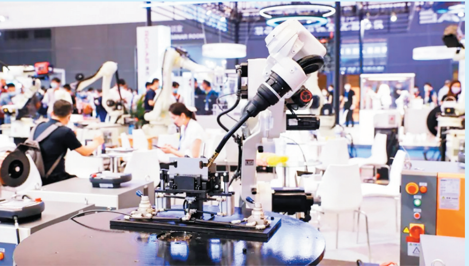
■7月18日至22日，亚太国际智能装备博览会将在红岛国际会展中心举办。图为上届展会资料照片。