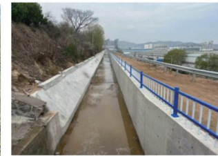
■改造后山体截洪沟

开拓路(前湾港路至淮河路)路段长约2700米,包含雨水管线翻建600米,现已完工,道路铣刨更新正有序推进。