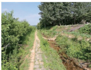
■改造前山体截洪沟

山体截洪沟明渠位于青岛西海岸新区大顶山北侧、昆仑山路西侧,总长750米,目前已完工。明渠北侧紧邻海尔新兴产业园、兴邦厨卫、京信电子等工业园区,企业密集,此段明渠为周边企业截流山洪发挥着重要作用。由于近几年雨季降雨量大,原截洪沟已出现局部破损,已有冲灌厂区现象。为消除此区域山洪对周边企业的不利影响,项目对明渠重新进行了设计,主体采用钢筋混凝土结构,加大了截面尺寸,其泄洪能力和稳固性、耐久性都得到了大的提升,为周边企业安全度汛提供了新的保障。