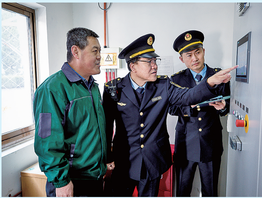
■生态环境执法人员进企业帮扶指导。