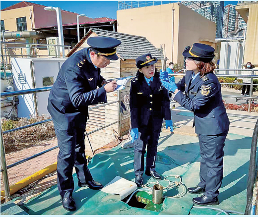
■生态环境执法人员深入企业现场检查。

2023年6月5日是第52个世界环境日，主题为“建设人与自然和谐共生的现代化”。今年，市生态环境局将把主题教育、优化营商环境与环境保护、推动发展紧密结合，力争全市生态环境保护工作取得更大成效。