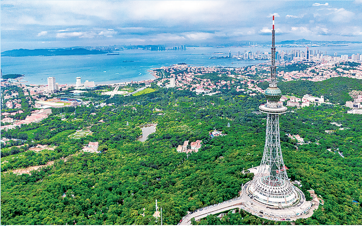
■从太平山俯瞰青岛城区，绿水青山共蓝天。