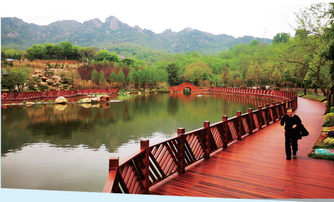
■浮山森林公园内，碧水绕青山。