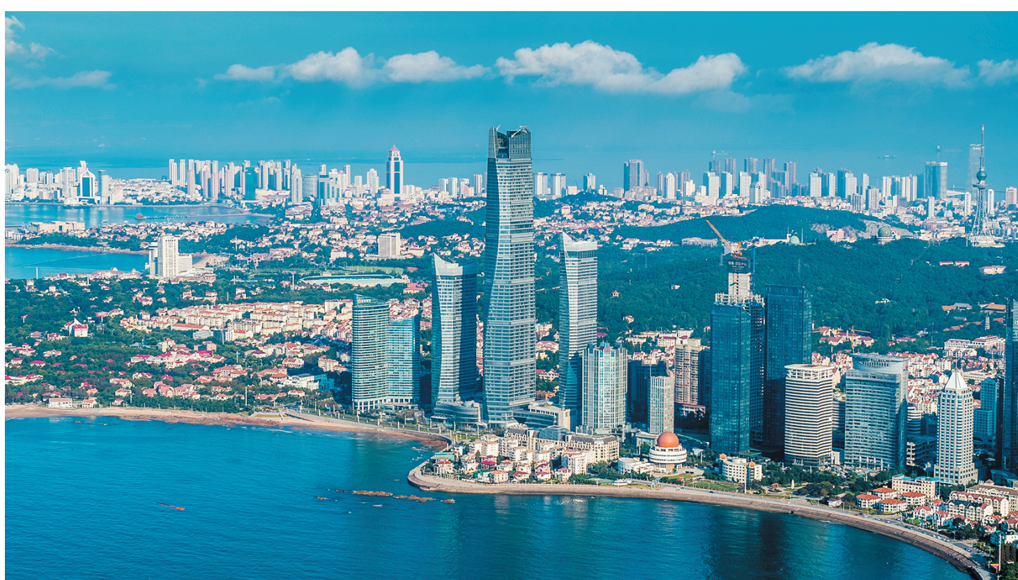
■青岛国信·海天中心。

作为青岛综合性超高层地标建筑,海天中心一直坚持并坚守“与超高层楼宇相符合的国际高