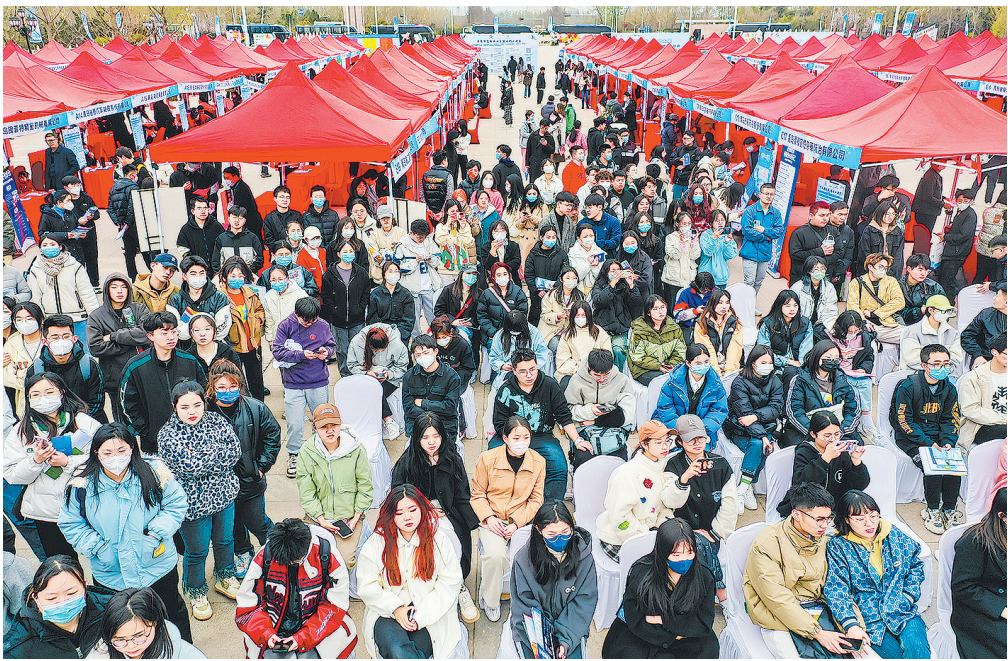
■今年以来,青岛市人社部门组织线上线下招聘会300余场,全力推动岗位供需双方高效对接。

一季度以来,青岛开展为期两个月的“2023春风行动暨就业援助月”专项服务行动,密集布局线上线下招聘会300余场,全力推动供需双方高效对接。加大对吸纳高校毕业生数量多的企业的政策、资金支持,营造爱才、迎才的良好城市氛围,让青年人才在岛城更有归属感。同时,做好在校大学生的实习实训工作,打好“提前仗”,力争留住“家门口”的人才宝库。市人社部门发布的数据显示,一季度,全市引进青年人才2.02万人,同比增长7.2%。