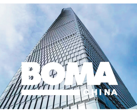
■青岛国信·海天中心通过BOMA COE认证。

经过BOMA评审专家为期3天对管理制度和现场检查认证审核,海天中心在营销与沟通管理、建筑管理、能源管理、环境管理、培训管理五个专项101个细项评定中,以认证得分均超过国际标准分达标的优异成绩,顺利通过认证,成为超高层城市综合体领域内,中国北方地区第二个(中信大厦为第一个)、山东省首个获得该认证的项目。