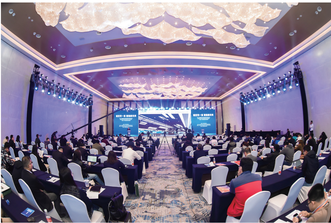
■4月28日青岛主题日活动举办

来自上海的一位专业观众有感而发:“现在哪里人最多?除了旅游景点,可能就属北京—青岛轨道展这样的大型展会现场了。今年我跑了不少展会,不仅在国内跑展会,还经常跑出国门,参加各类海外展会。”火爆的展会也体现出中国企业的信心正