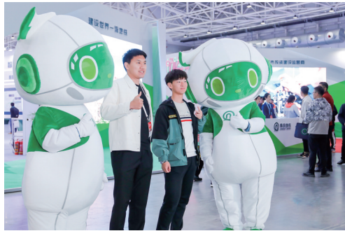
■观众与青岛地铁IP形象“青小铁”合影