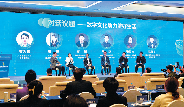
■主题论坛上，与会嘉宾纵论“数字文化助力美好生活”。

新表达文化，让技术在文化数字化战略里面找到恰当的位置，而不是单纯发展技术。”他说，下一步青岛在文化装备制造、文化内容生产以及文化标识生产和体验性产品打造方面都有机会，希望青岛能有更好的谋划，吸引全国资源一起在平台上共同推动文化数字化发展。