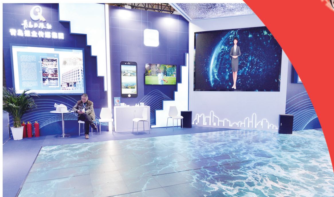
■青岛日报社展位采用数字技术呈现出波光粼粼的海面。邢志峰 摄

抬头仰望是一片星空，漫步其间有海浪奔涌……徜徉于数字文化山东馆，以蓝色为主基调的青岛日报社、青岛报业传媒集团展区引来众多与会观众驻足参观。