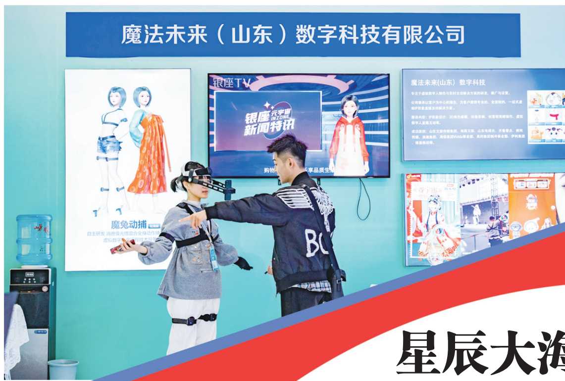
■魔法未来打造的虚拟数字人，接入了全身动作捕捉技术。

文化与科技的深度融合，正在齐鲁大地上跑出发展“加速度”，为数字强省、文化强省建设贡献力量。