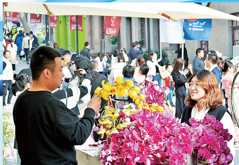
■老城的人气与日俱增。