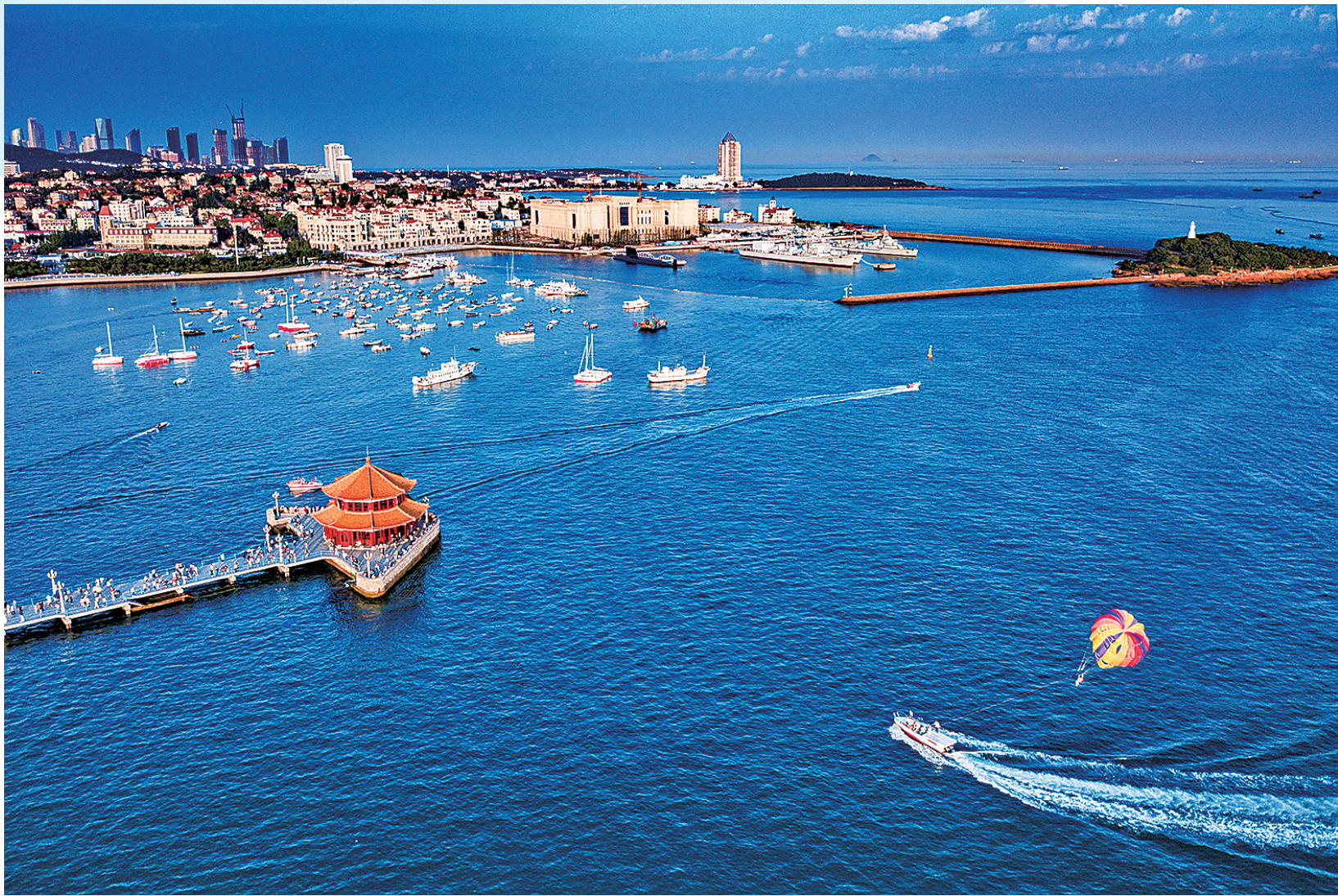
■老城区正焕发出活力。