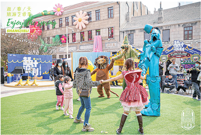
■市民参与逛春天旅游艺术季。