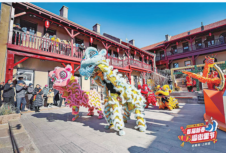
■新春逛街里节上丰富的民俗活动。