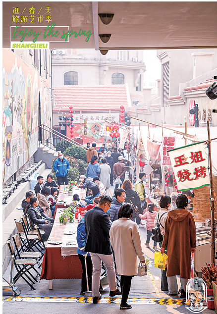
■逛春天旅游艺术季中的百家宴。