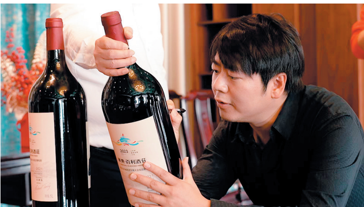
▲市民游客品鉴崂山矿泉系列饮料。