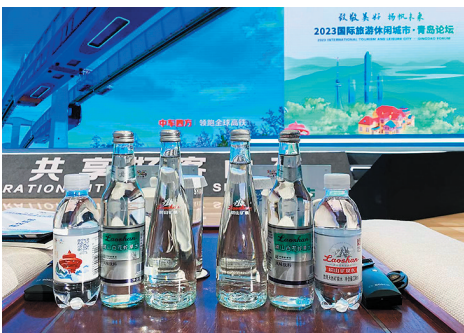
■青岛饮料集团产品矩阵亮相省旅发大会。