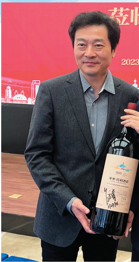
■吕思清出席青岛饮料集团新品发布活动。