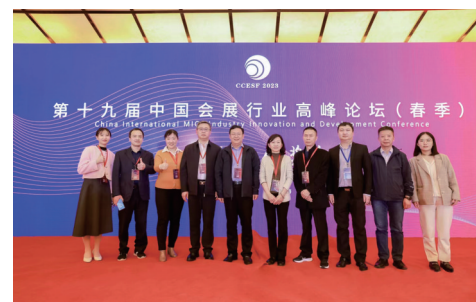
参会的青岛代表团成员