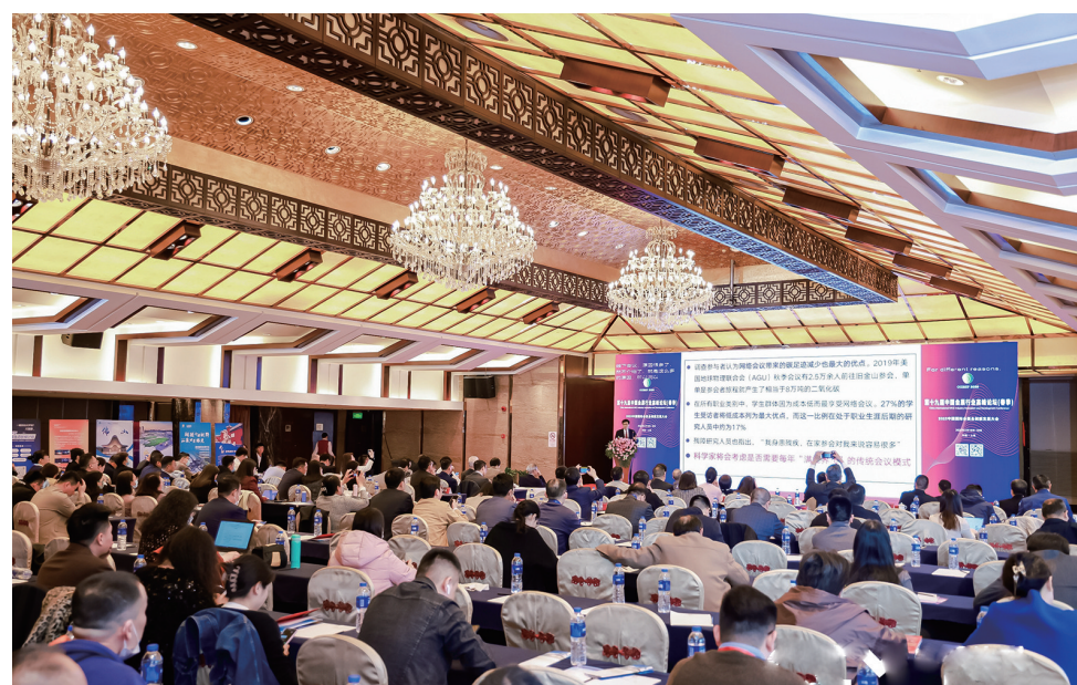
2023中国国际会展业创新发展大会现场

作为一个外向型窗口行业，会展业是了解经济社会发展的直接路径，折射着一座城市的活力、开放度与发展潜力。3月16日至18日，被誉为中国会展业“奥斯卡”的2023中国国际会展业创新发展大会(CCESF)、第十九届中国会展行业高峰论坛(春季)在上海举办，山东(青岛)宜居博览会等展会代表组成的青岛军团斩获多项大奖。围绕建设“充满活力、富有魅力的国际会展名城”目标，青岛正不断推进产展融合发展，为城市高质量发展注入磅礴动力。