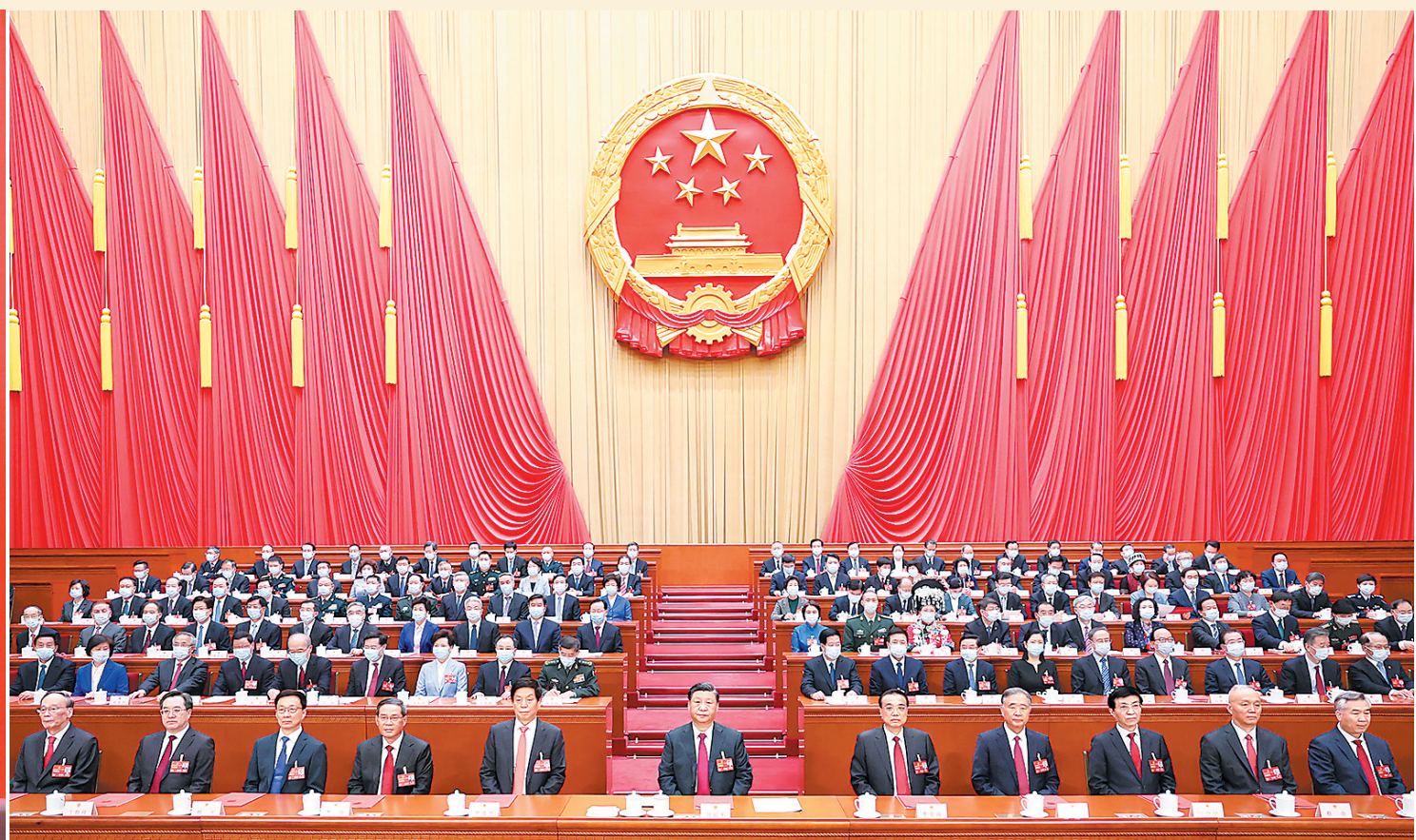
3月13日,第十四届全国人民代表大会第一次会议在北京人民大会堂闭幕。中共中央总书记、国家主席、中央军委主席习近平发表重要讲话。