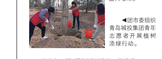
▲团市委组织青岛城投集团青年志愿者开展植树添绿行动。

青岛日报/观海新闻记者 杨琪琪 本报3月12日讯 为团结引领全市广大团员青年用志愿服务的方式传承雷锋精神,为全国文明典范城市创建贡献青春力量,12日,在我国第45个植树节到来之际,团市委组织300余名来自市北、莱西、城投集团的青年志愿者在市北区桦林山、莱西市水集街道产芝村和姜山产业新城、青岛东收费站、工程项目一线开展“植树添绿 共创文明典范城市”周末青年志愿行动。