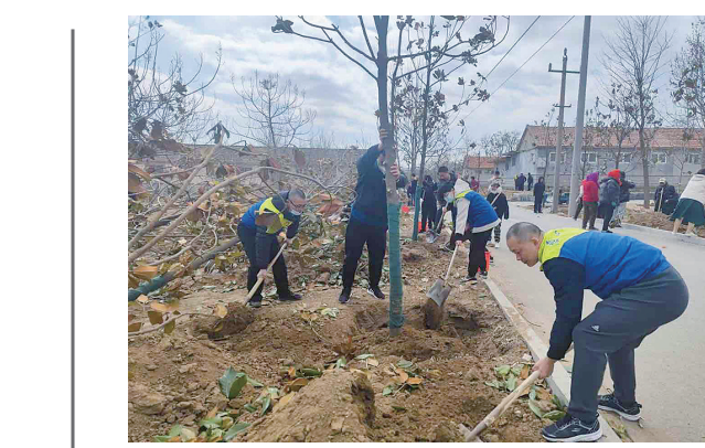
▲团市委组织青年志愿者在莱西市水集街道产芝村植树添绿。