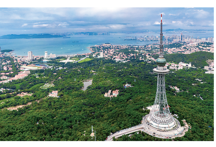
太平山郁郁葱葱。

一年多来,太平山正在演绎一场蝶变。近日,在延安一路附近,一条南起中山公园花卉园、北至动物园西门的500余米架空栈道蜿蜒伸展,成为一道全新的风景线。设计人员介绍,设计之初曾考虑直接把延安一路人行道改建为