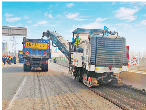
西海岸新区S215黄大路大乔至宝山段大修工程施工现场。