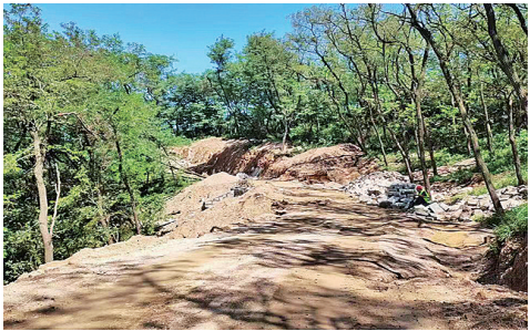
浮山防火通道(绿道)市南段建设前。

“以前登山赏夕阳都得急匆匆下山,不然天一黑就不好下山了,现在不仅道路修缮一新,还安上了路灯,赏景也更加从容了。”“现下,浮山周边很多围网栅栏都拆除了,让自然真正融入了城市之中。”“沿浮山绿道导引一路登高,观城望海的美景一览无余。”……谈起浮山的变化,