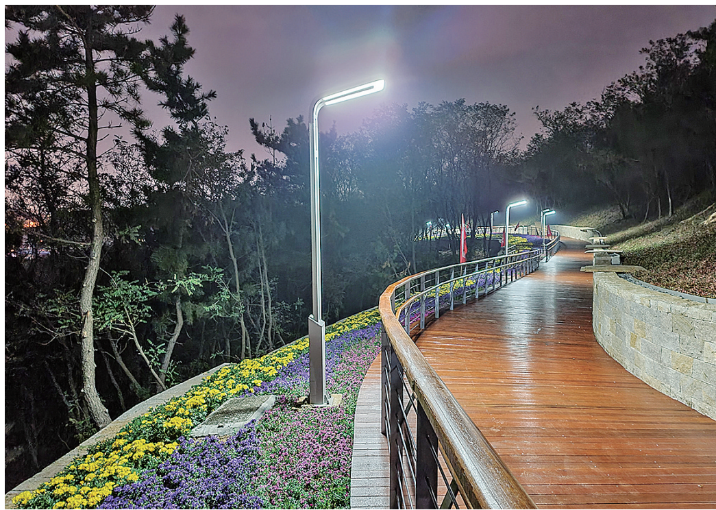
浮山防火通道(绿道)市南段建设后。