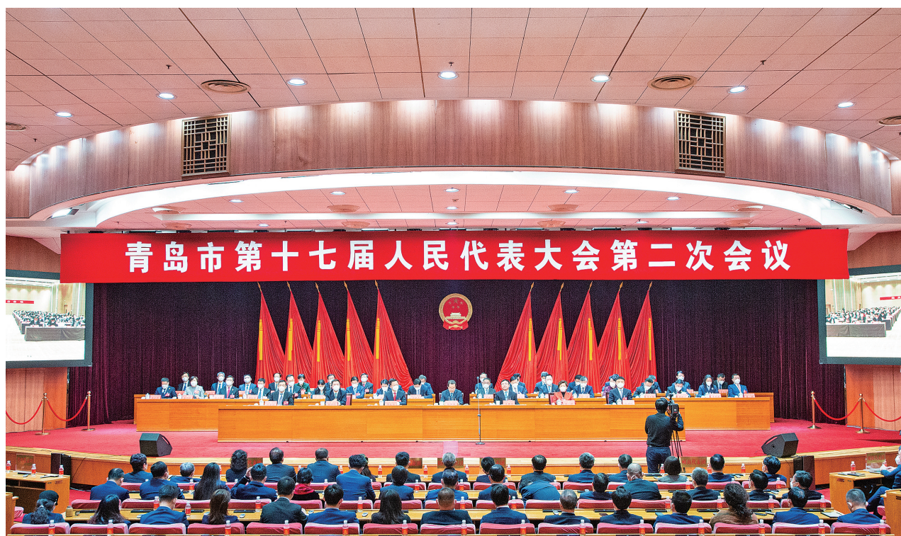
1月1日上午,市十七届人大二次会议在市级机关会议中心胜利闭幕。

陆治原指出,党的二十大描绘了全面建设社会主义现代化国家的宏伟蓝图。今年是全面贯彻落实党的二十大精神开局之年,我们要以积极担当作为的精神为党和人民履好职、尽好责,咬定目标不放松,撸起袖子加油干,一步一个脚印把蓝图变成现实,奋力推动各项工作开创新局面。要始终坚持正确政治方向,深入学习贯彻习近平新时代中国特色社会主义思想,坚定不移贯彻落实