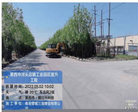
工业园区提升工程

围绕做好土地供应和基础配套,建设集仓储配送、冷链加工、文化展示等功能于一体的半岛物流中心。依托正在建设的智慧农场项目,联合京东商城、京东物流等京东资源,服务全产业链的各环节,大力发展智慧农业,探索打造农业互联网平台。莱西市通过数字化技术的应用,使河头店镇有26个大棚不仅带来增产增效,农民增收,还催生了新的可复制的种植模式。