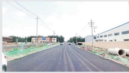
食品产业集聚区基础设施提升工程