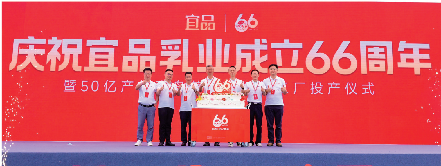
庆祝宜品乳业成立66周年暨50亿产值青岛莱西羊奶粉工厂正式投产

工业产业集聚区是新旧动能转换的主战场，也是促进高质量发展的重要载体。2022年以来，莱西市牢固树立新发展理念，立足产业基础、区位优势、资源条件和环境承载力，集中力量建设一批纳入全市战略层面的产业集聚区，坚持“产业集聚、技术创新、特色鲜明、配套率提高、高质量发展”的推进路径，打造产业竞争制高点、培育经济增长极、建设新旧动能转换引领区。沽河街道按照莱西市委市政府安排部署，以争创国际农产品加工示范区、打造青岛市五星级食品产业集聚区为目标，以“作风能力提升年”活动为抓手，努力推进莱西市莱西食品产业集聚区创新发展、提质增效，为推动高质量发展贡献沽河力量。