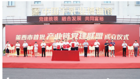
莱西市首批产业链党建联盟成立仪式