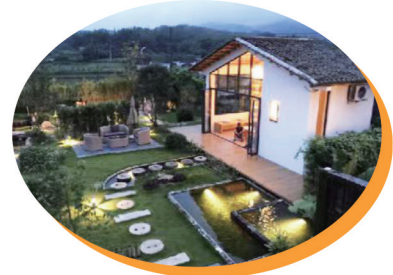
产芝湖新村特色民宿区

产芝湖乡村振兴示范片区顺利入选青岛市十大乡村振兴示范片区,目前片区规划已顺利完成。截至目前,片区拥有在谈项目11个,总投资1.5亿元;新签约项目13个,总投资2.9亿元,新开工项目11个,总投资1.7亿元。按照“红色党建、绿色发展、金色未来”的思路,以推动农业提质增效、农民增收致富为目标的乡村振兴“水集样板”已经形成,并有望成为莱西市经济社会和谐发展的名片。吴鑫涛 赵吉亭