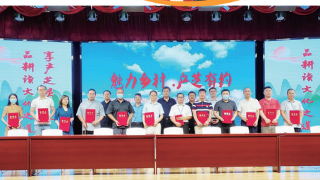
乡村振兴红色合伙人项目签约仪式