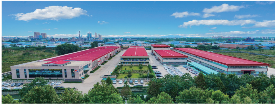
青岛锐智智能装备科技有限公司

新项目连同存量实体经济,共同构成莱西市“中优”的核心保障,提供着对宜居宜业新城芯的重要支撑。