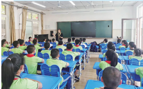
杭洲路小学的孩子在新改造的校舍内上课

在这一过程中,作为莱西“城芯”位置的莱西市水集街道表现优异。2022年以来,集中时间和精力抓开工、促进度,项目建设稳步推进,共有省、市、莱西级项目14个,其中山东省“双招双引”项目2个,青岛市重点项目7个,莱西市重点项目5个,总投资76.35亿元。除了刚刚开业的万达广场,王府井购物中心、青岛新万福食品有限公司屠宰加工(二期)、乐好国际城商业综合体、三幸万福等重量级项目均在高速推进中。