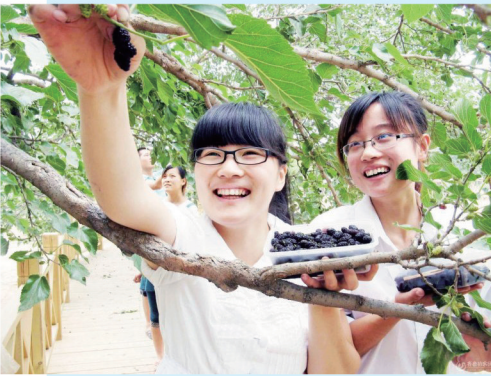
仙足山风景区享受采摘乐趣