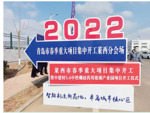
莱西市2022年春季重大项目集中开工暨中建材5.0中性硼硅药用玻璃产业园项目开工仪式