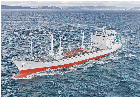
▲全国首艘超低温冷藏运输加工船在青岛西海岸新区投入使用。