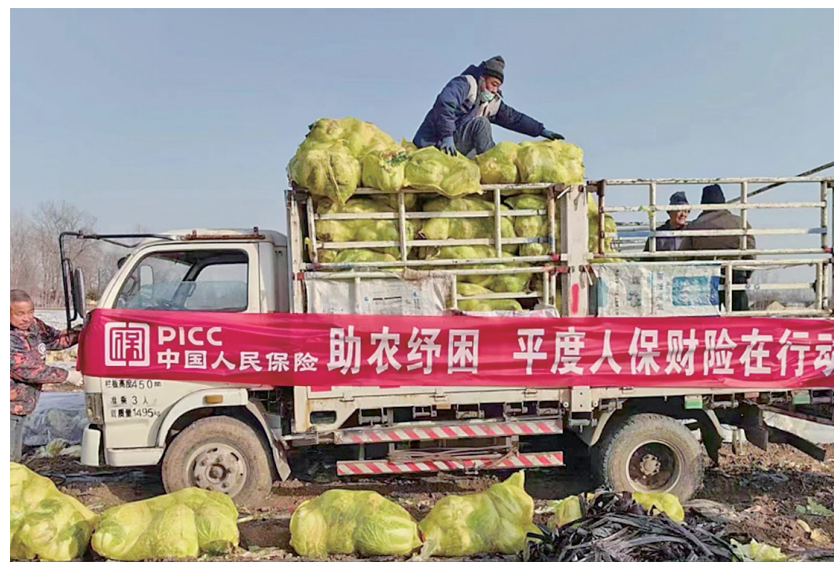
■疫情期间,为帮助菜农解决蔬菜滞销问题,平度人保财险购买2.6万斤白菜赠送给贫困家庭。