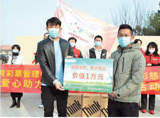
■体彩向学校捐赠体育、教学用品。

多年来，山东省体育彩票管理中心青岛分中心一直牢记公益初心，努力践行公益使命，积极开展爱心助学、敬老慰问、困难救助等多种形式的捐赠和救助活动，及时向困难群众伸出援手，不断向弱势群体送出关爱，积极推动岛城公益事业发展。下一步，山东省体育彩票管理中心青岛分中心将继续筹集公益金开展青少年体育运动、“爱心书屋”捐赠活动，捐助生活困难学生，为少年儿童健康成长积极贡献力量，支持青岛体育事业高质量发展。（郑钦泽）