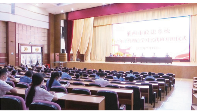
莱西市政法系统青年干警理论学习实践班开班仪式