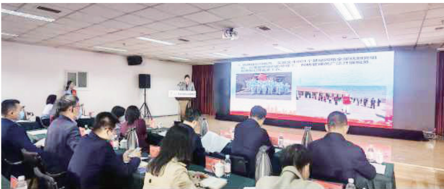
“税务+网格”服务工作机制现场会

2022年8月13日，莱西市公安局举行夏季治安打击整治“百日行动”暨“雷霆打击·利剑护航”专项行动赃款赃物发还大会，将价值1300余万元的现金、电脑、电动车、手机、照相机、生活用品、企业原材料等涉案财物公开发还给受侵害的群众。这次活动引起莱西市全社会的热烈关注，得到市民的广泛认可。