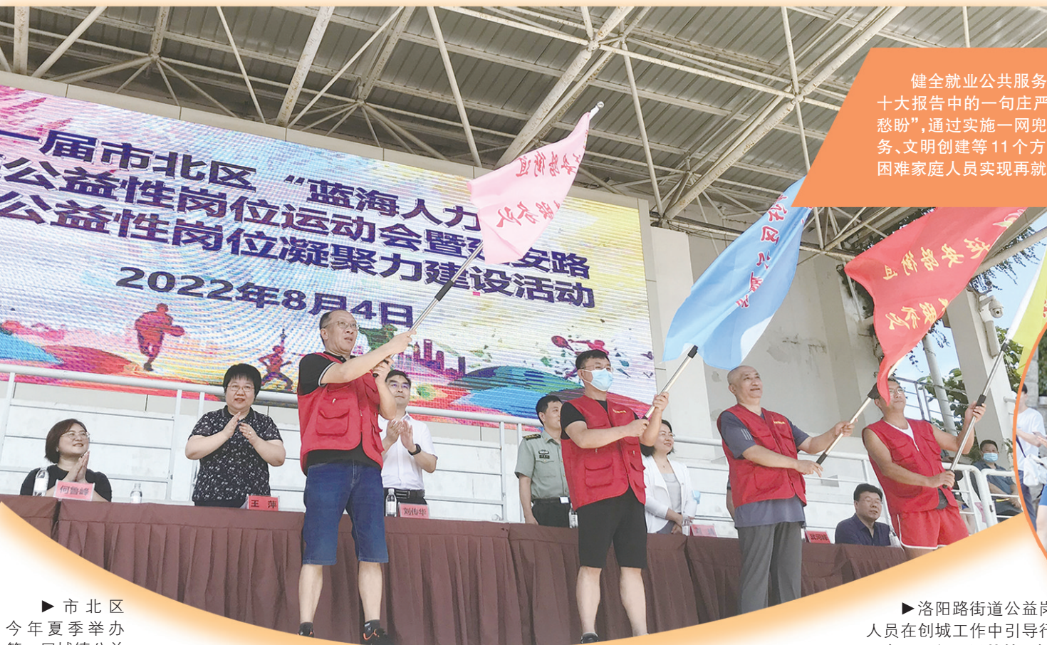
►市北区今年夏季举办第一届城镇公益性岗位运动会。

健全就业公共服务体系,加强困难群体就业兜底帮扶,是写在党的二十大报告中的一句庄严的承诺。市北区始终紧盯就业困难人员的“急难愁盼”,通过实施一网兜底、“全链条”安置、考评优选,在疫情防控、就业服务、文明创建等11个方面精准开发城镇公益性岗位,今年共帮助5720位困难家庭人员实现再就业,安置量占全市城镇公益性岗位总量的31%。