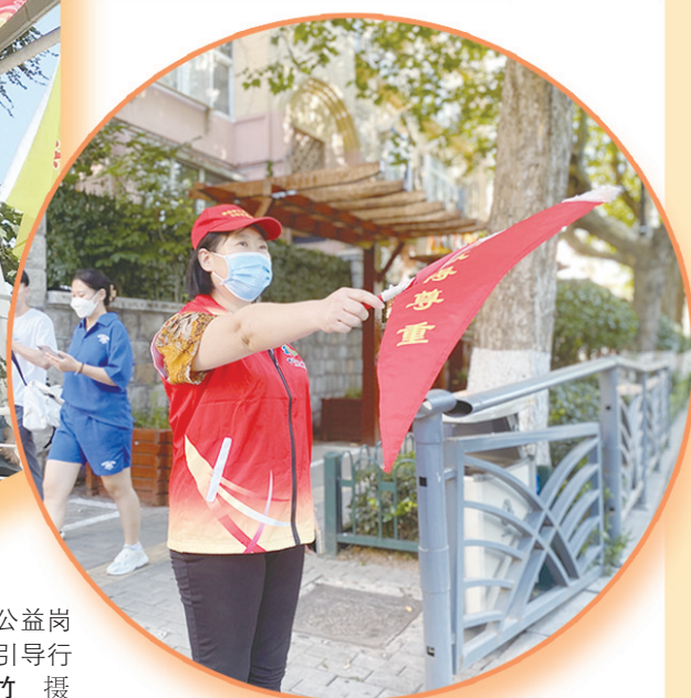
►洛阳路街道公益岗人员在创城工作中引导行人文明通行。

健全就业公共服务体系,加强困难群体就业兜底帮扶,是写在党的二十大报告中的一句庄严的承诺。市北区始终紧盯就业困难人员的“急难愁盼”,通过实施一网兜底、“全链条”安置、考评优选,在疫情防控、就业服务、文明创建等11个方面精准开发城镇公益性岗位,今年共帮助5720位困难家庭人员实现再就业,安置量占全市城镇公益性岗位总量的31%。