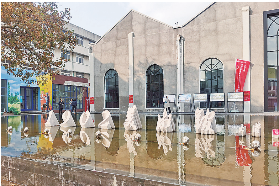
■纺织谷、历史城区、青岛国际邮轮港等老城区文化创意产业新高地正在崛起。图为纺织谷1902美术馆。

这只是四方街道探索有效方法治理“顽疾”的一个缩影。据了解,今年以来,四方街道主动聚焦“作风能力提升年”工作部署,大力倡导“真严实快”的工作作风,坚持听民声、惠民生、解民忧、暖民心,发挥党建引领基层治理和发展的群众参与、协同共治优势,以人员力量、资源要素有效叠加、有机融合,已先后处理解决宣化路80号污水管道淤堵、重庆南路48号院晾晒困难、人民一路盲道砖缺损松动等问题,推动党的建设与基层网格微治理良性互动。