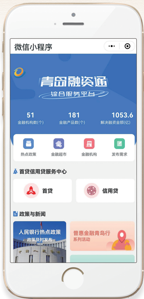
青島市民营和中小微企业首贷信用贷线上服务中心

商业银行民营和中小微企业首贷信用贷服务中心将实现服务热线、服务内容和产品服务“三个公开”，即向社会公众公开一部服务热线电话，公开本行对民营和中小微企业的授权清单、授信清单和尽职免责清单等“三张清单”，公开针对不同客户群体特点推出的普惠小微金融产品。 通过“三个公开”，明确各银行贷款申请材料、所需时间、办理环节、特色产品、服务电话，为广大市场主体了解银行授权情况和授信流程提供窗口，融资时能够“货比三家”，从而能够引导银行机构下沉服务重心、下放审批权限、提高审批效率、特色产品，便于小微企业客户贷前提交申请资料、贷中明晰审批进程、贷后加强用途管理，推动实现小微企业融资流程更加透明，切实提升银行机构小微企业金融服务能力。