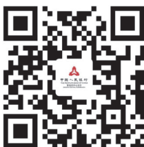
“延期还本付息码上办”二维码

充分利用营业网点、门户网站、手机App、微信公众号等途径进行政策宣传解读，扩大政策的知晓度和覆盖面，及时公示办理条件、所需材料、办理流程及办理时限，提高小微企业办理贷款延期的便利度。人民银行青島市中心支行已通过官方微信公众号发布《青島市商业银行小微企业贷款延期还本付息政策明白纸》，并制作“延期还本付息码上办”二维码。各银行机构在各支行、网点等经营场所门口醒目位置张贴宣传二维码或通过微信公众号进行转发，积极向小微企业、个体工商户等市场主体宣传解读政策，拓宽支持政策知晓度和覆盖面，最大程度便利市场主体办理贷款延期还本付息。