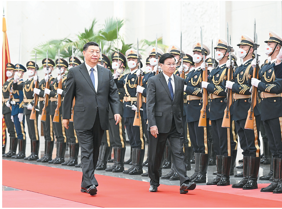
11月30日，中共中央总书记、国家主席习近平在北京人民大会堂同老挝人民革命党中央总书记、国家主席通伦举行会谈。

新华社北京11月30日电 11月30日，中共中央总书记、国家主席习近平在人民大会堂同老挝人民革命党中央总书记、国家主席通伦举行会谈。双方强调，要秉持“长期稳定、睦邻友好、彼此信赖、全面合作”方针和“好邻居、好朋友、好同志、好伙伴”精神，政治上互尊互信、经济上互惠互利、人文上相知相亲，不断深化中老命运共同体建设，为推动构建人类命运共同体作出积极努力和贡献。 习近平首先表示，江泽民同志因病抢救无效于今日在上海逝世。江泽民同志是中国党、军队和各族人民公认的享有崇高威望的卓越领导人，伟大的马克思主义者，伟大的无产阶级革命家、政治家、军事家、外交家，久经考验的共产主义战士，中国特色社会主义伟大事业的杰出领导者，中国共产党第三代中央领导集体的核心，“三个代表”重要思想的主要创立者。我们沉痛悼念江泽民同志，将化悲痛为力量，按照中共二十大的部署，为全面建设社会主义现代化国家、全面推进中华民族伟大复兴而团结奋斗。 通伦对江泽民同志逝世表示沉痛哀悼。他表示，这是中国党和人民的巨大损失，老挝党和人民感同身受。江泽民同志担任党和国家主要领导人期间，带领中国人民取得了重要发展成就，为中国特色社