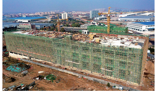
■国际陆港生鲜电商孵化基地项目建设现场。

生鲜电商孵化基地项目由青岛中道食材供应链有限公司投资3.05亿元建设，是青岛市重点项目，占地23亩，主要建设约2.5万平方米冷链仓储物流中心、生鲜电商运营中心，打造集进口、仓储、加工、运输、销售、金融服务、培训孵化全流程服务的国家级生鲜电商示范基地。项目预计明年5月份竣工投产。