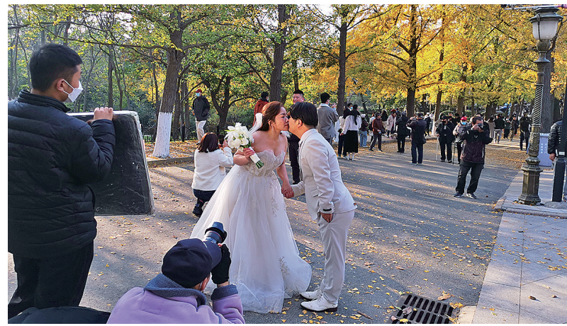
秋日融融的居庸关吸引众多情侣打卡。

风物潋滟,四时情深,初寒渐起,畅游青岛再一次开启最美时节。无论是山海风光的壮阔旖旎,还是景区景点的悠然惬意,市民游客频频开启“微度假”,融入水彩画般浓郁的初冬盛景。一次打卡,多元体验,伴随着旅游品质提升三年攻坚行动的展开,宜游城市的鲜活质感进一步凸显。